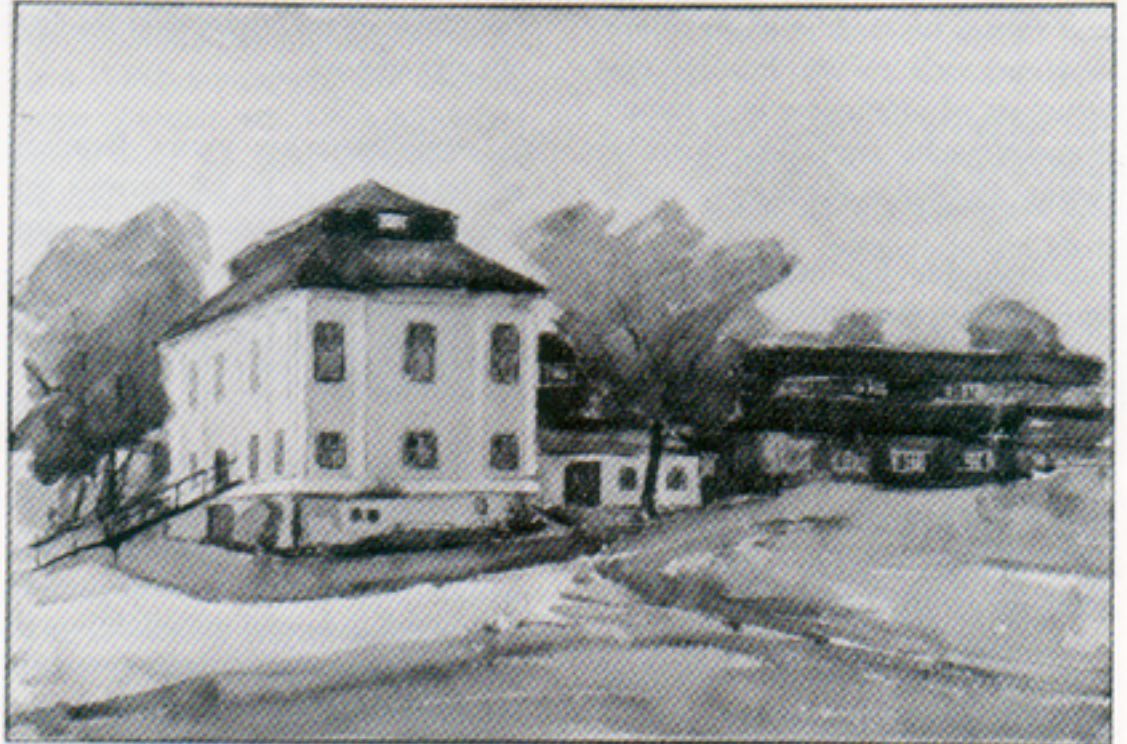
Det här är Repslagarebanan, östra banhuvudet, Lindholmen i Karlskrona. I de här byggnaderna från slutet av 1600-talet ligger Kaserstryckeriet.

Organisatoriskt kommer tryckeriet att inordnas i TI och samordnas med tryckeriet i Växjö. Inriktningen för verksamheten blir som tidigare blankett-tryck. Genom nyinvesteringar på ca 750 000 kr kommer vi att få en bredare och mer rationell produktion.