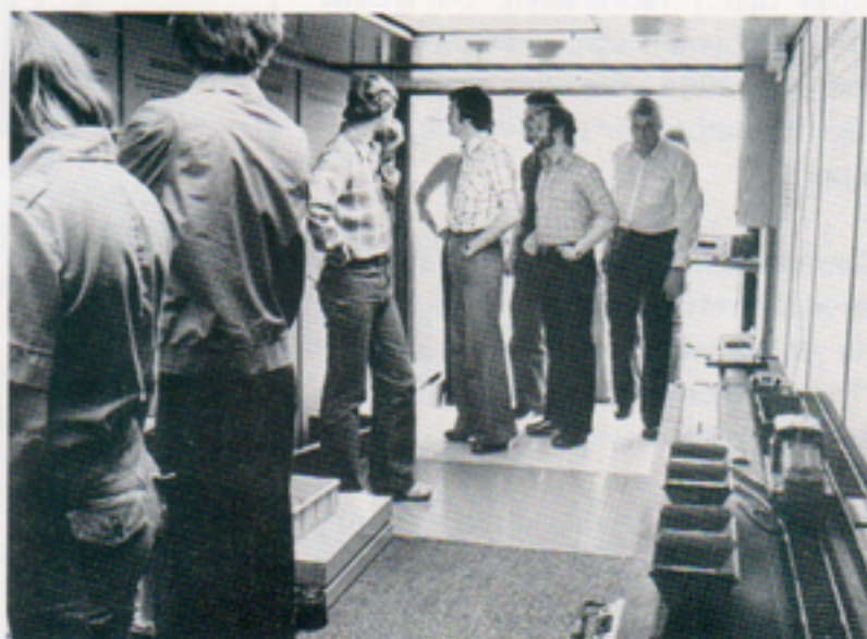
I modelljärnvägen finns modeller av vagnvågarna Nomad och Trapper, båda från vårt dotterbolag Samefa. Folket baktill i bussen står på en truckvåg.