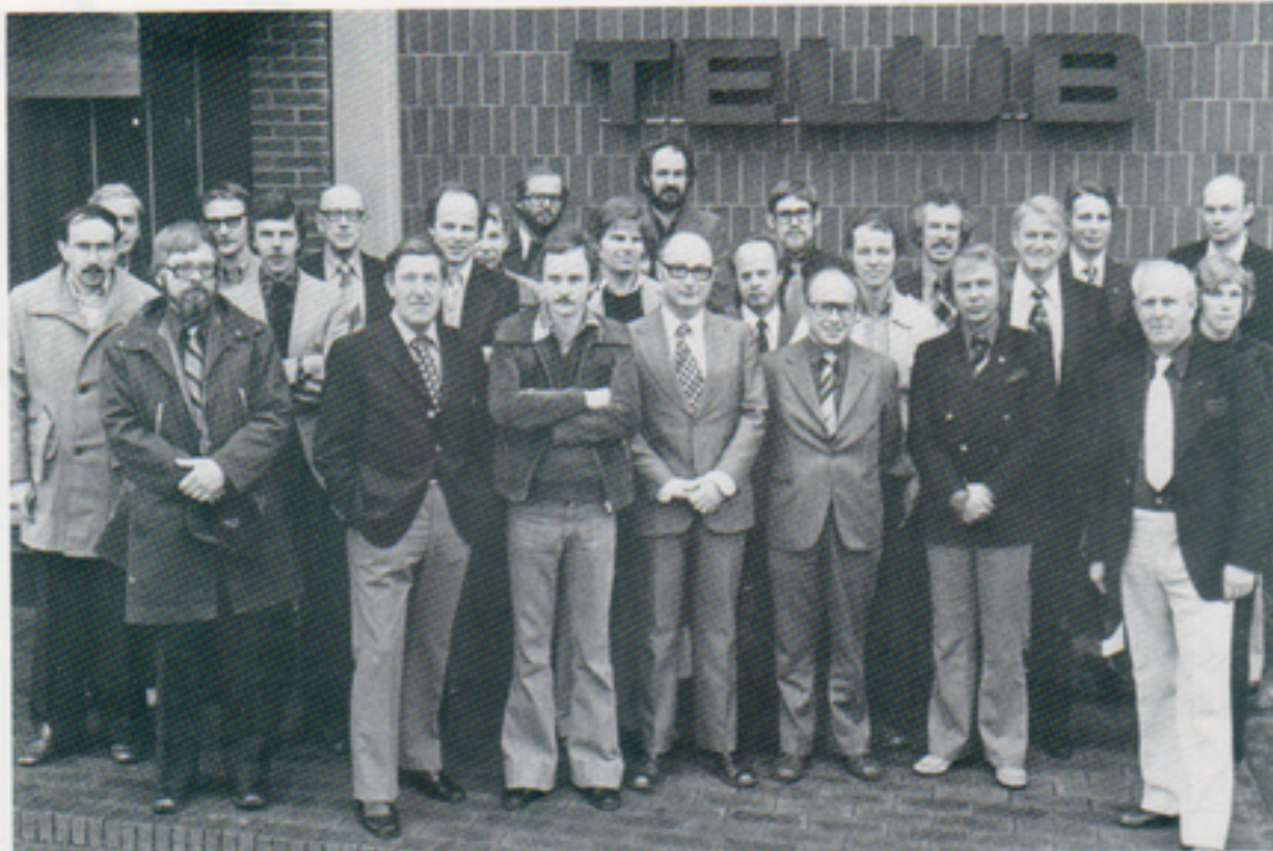
Teknikinformatörer från bl a industrin, statliga organ och fackpress samlade till vårkonferens

Konferensen avslutades med grupparbeten och efterföljande diskussion. ■