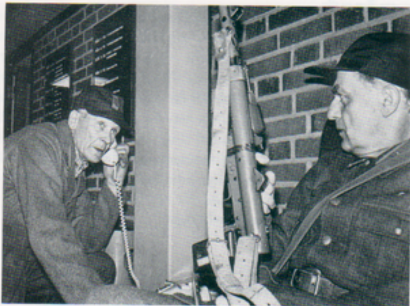
Telefonväxeln bemannas och hemvärnarna får order att bege sig till sina försvarsobjekt.