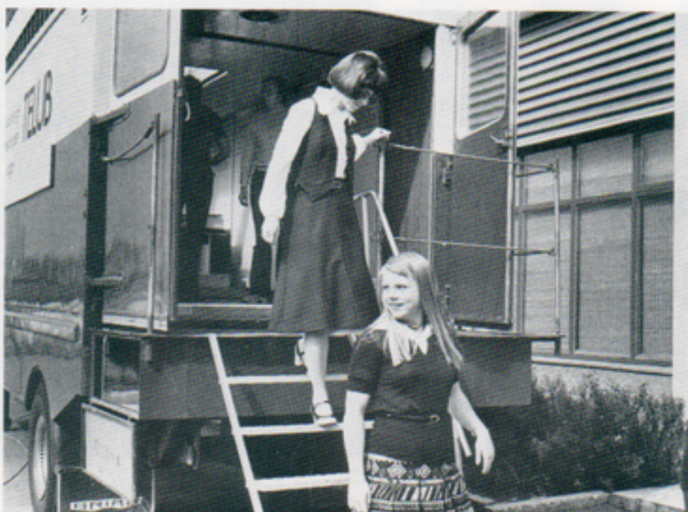
När utställningsbussen kom till huvudkontoret i slutet av maj, var det första gången som Telubanställda kunde se vårt kompletta vågprogram på utställning.

I bussen, som vi chartrat av firman Utställningsbussar i Arboga och som körs av Thore Bykvist, presenteras Telubs hela program av vågar med kapacitet från något kilo upp till 75 ton, de tyngsta i form av modeller. ■