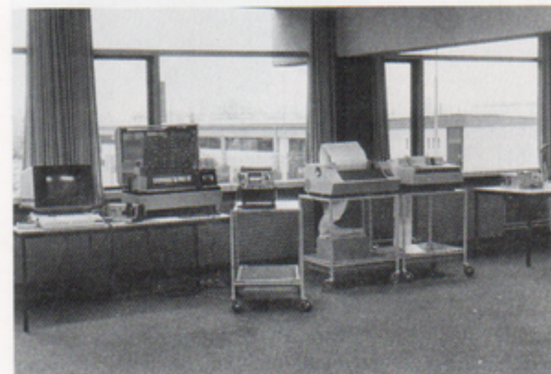
I de nya verkstadslokalerna i Glostrup finns utrustning för olika slags test. Här är Incoterm SPD 20/20, oscilloscop och två Centronics dataprinter.