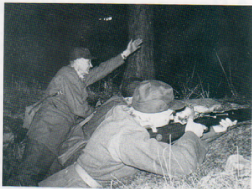
En skyttegrupp har gått i ställning vid Ljungadalsverkstaden och gruppchefen pekar ut varifrån det fientliga anfallet kan väntas.