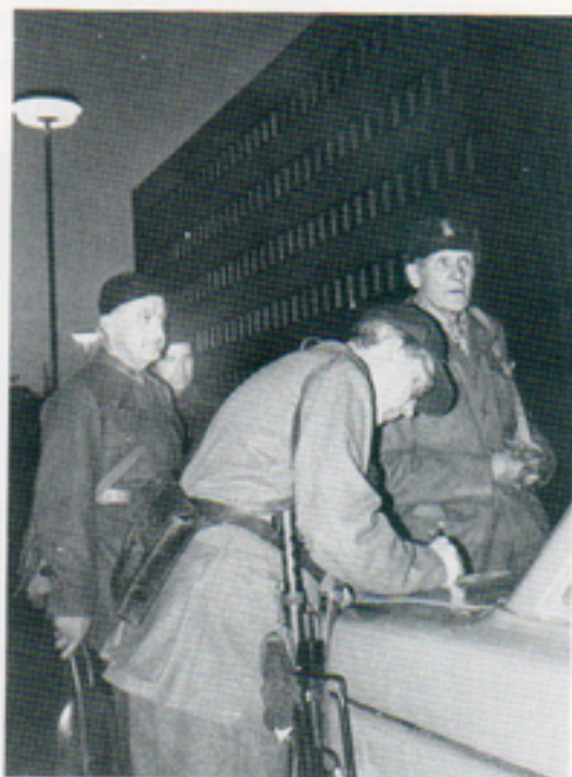
Hemvärnsmännen anländer till Telubs huvudkontor efter kupplarmet. Gruppchefen ger lägesrapport och instruktioner.

Hemvärnsmän, bilkårister och lottor begav sig till sina försvarsställningar, och på våra bilder kan du se hur Telubs huvudanläggning i Växjö försvarades av inkallade hemvärnsmän. ■