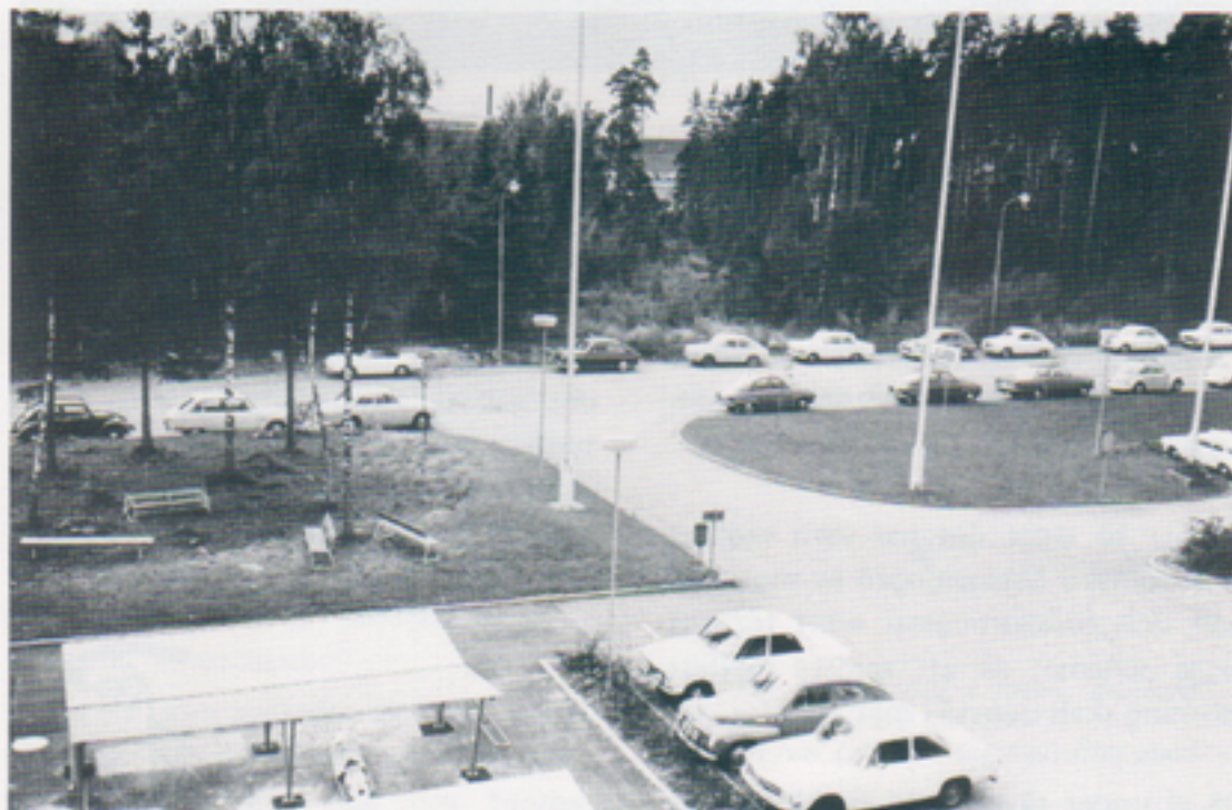
Det var inte så länge sedan det såg ut så här vid Ljungadalsgatan. Känner Du igen Dig?

Efter att ha legat kalhuggen och "smälandsstenig" i ett par år har marken mittemot Telub nu börjat anta lite mer ansade former.