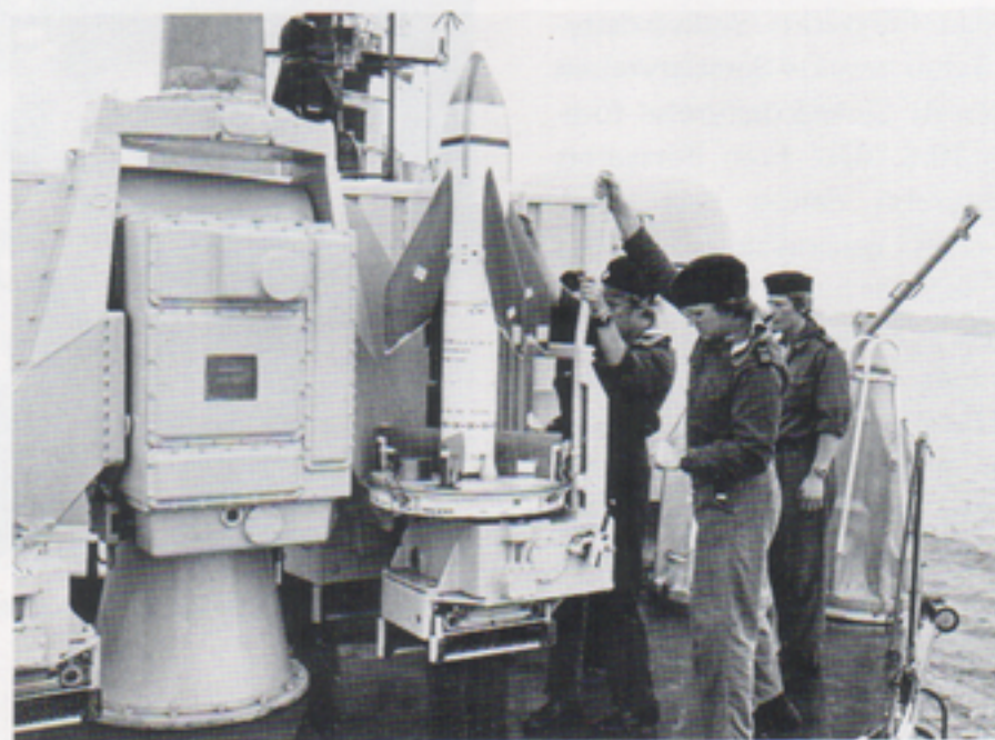
Roboten står färdig på startstället. Också här görs en sista kontroll före skott.

I väntan på skott kontrollerades allting ytterligare en gång. Väderleksutsikterna ingav oss hopp om att skjutningarna skulle kunna genomföras, sjöhävningen var måttlig och sikten relativt god.