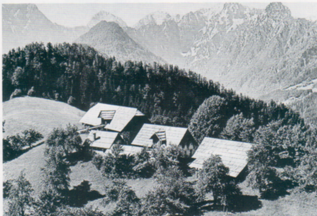
Pusan försvinner i backspegeln och vägen klättrar uppåt. Det finns utrymme bara för enstaka gårdar på sluttningarna

Kopparslagarna som ivrigt hamrade kopparplåt till fat, skålar m m var ett idylliskt inslag. Sadelmakeri, plåtslageri, garveri med flera hantverk utövades i små lokaler eller på gatan. Från centrum av stan avgår linbanan till det berg på vars ena sluttning Sarajevo ligger. Från den 1629 m höga toppen erbjuds en enastående panoramautsikt över staden. Naturligtvis besöktes ock-