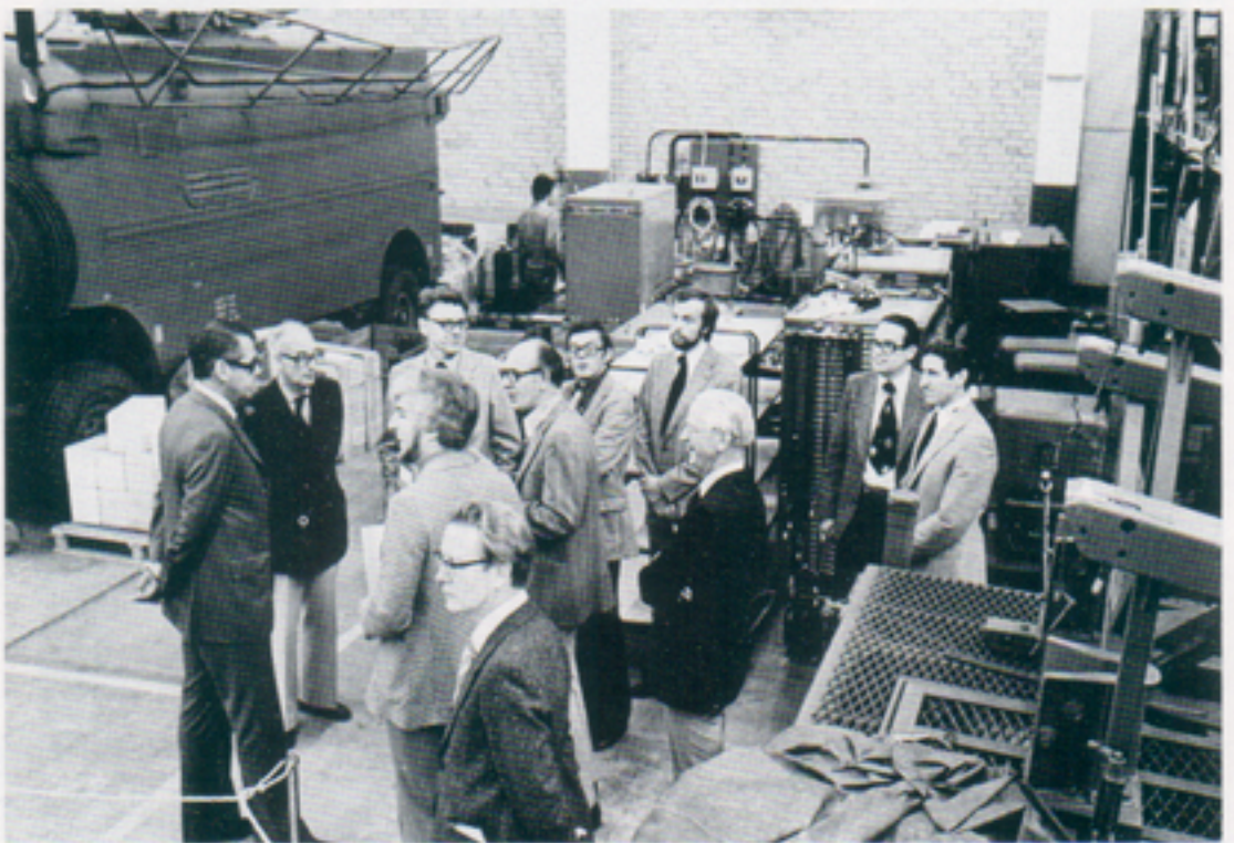
Som ett led i informationen visades våra verkstadsresurser och pågående arbeten för SjuS

Dagen avslutades med undertecknande av huvudverkstadsavtalet mellan Försvarets Sjukvårdsstyrelse och Telub. Detta avtal ger Telub huvudverkstadsansvaret för flertalet medicinska tekniska utrustningar inom försvaret, vilket innebär fler uppdrag för tekniska avdelningens sektion TAR och verkstadsavdelningens sektion VAU.