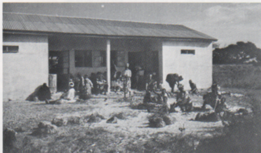
Kliniken i Kunkujang har dagligen många hjälpsökande från när och fjärran

Kronobergs Länsförbund beviljade bidrag till starten av en "klinik" och lön till en sköterskeassistent. Kliniken förlades till byn Kunkujang.