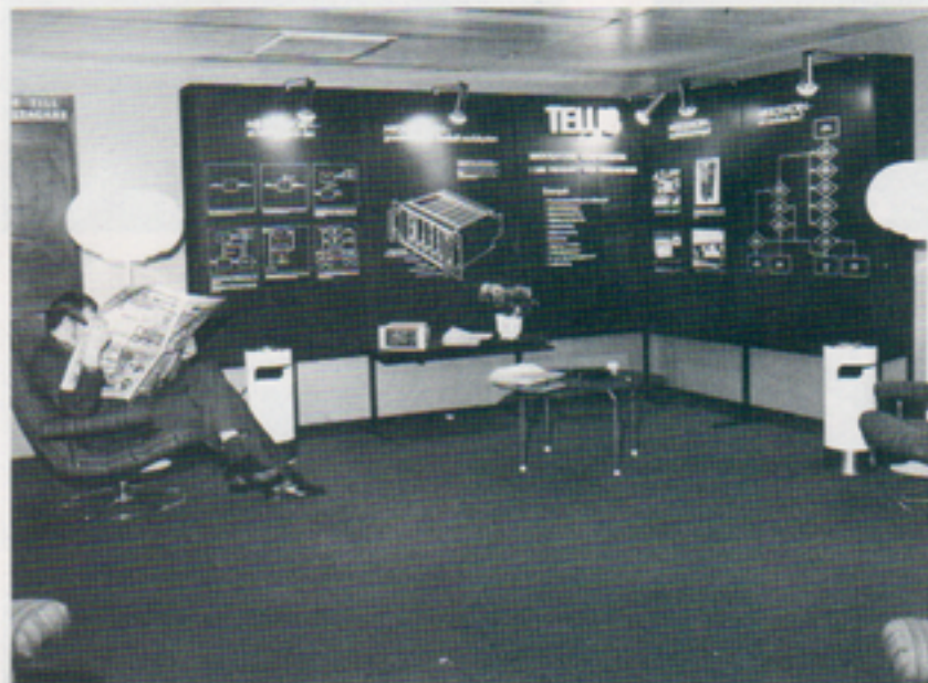
Telubs del av utställningen

Andra utställare än TELUB var Burroughs AB, Comator Data AB, Data Saab Sverige AB, Industridata AB.