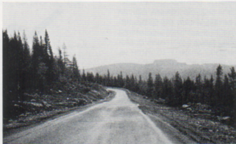
På smala och slingrande vägar for man genom norrlandsterrängen