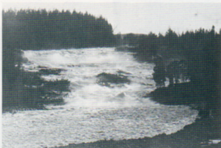
Storforsen, som vi här ser en del av, har en sammanlagd fallhöjd på c:a 80 m.