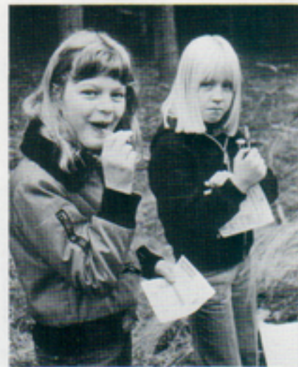
...och dom som tyckte kola var toppen.