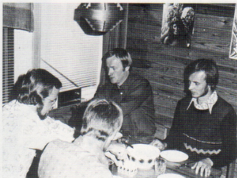
Första frukost eller sista kvällsmålet – det är frågan