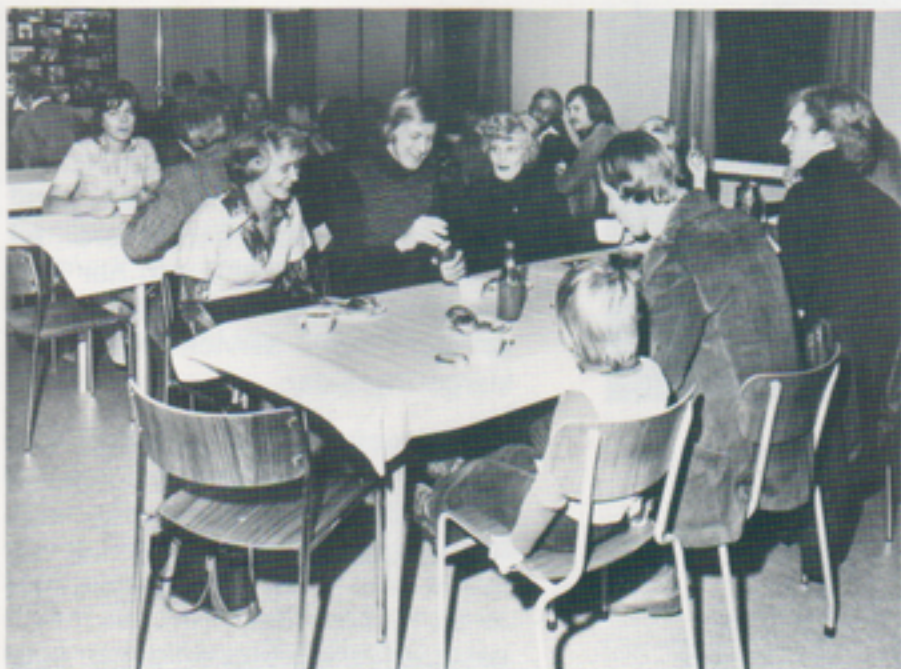
Efter visningen smakade det gott med kaffe, läsk, bullar och kakor i matsalen.