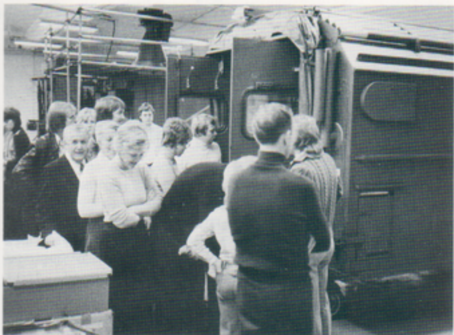
Radiostation 630, här i serieprototyp, väckte allmänt intresse. De allra flesta gjorde också ett besök inuti den med teknisk utrustning välfyllda överbyggnaden.