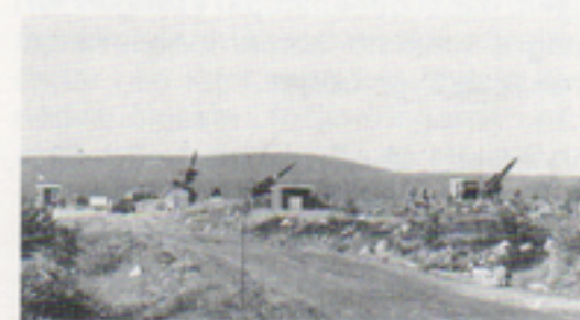
Enheterna grupperade för provskjutning