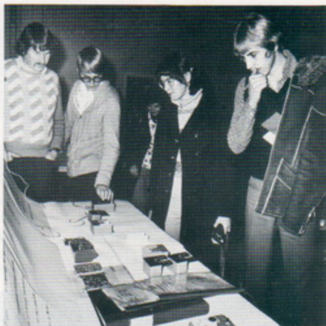
Termotac – termometer för synskadade – är en av Telubs produkter inom handikappområdet.