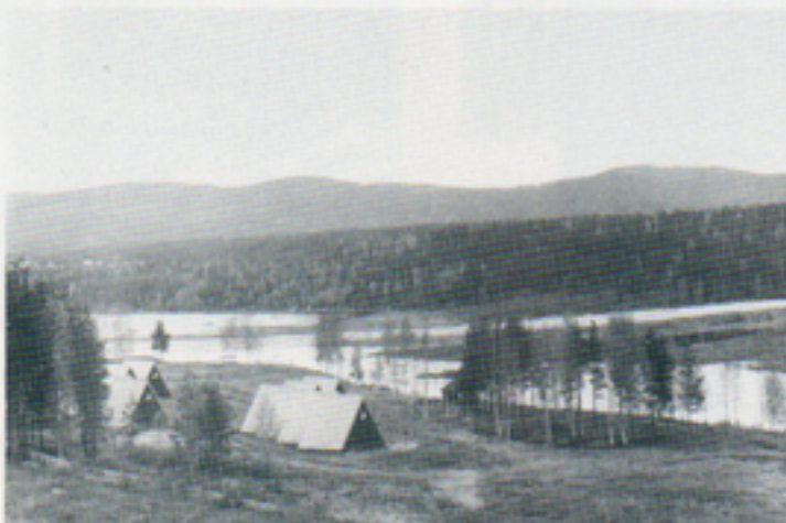
Stugbyn i Bredsel, där man ibland fick tillfälle att sova.