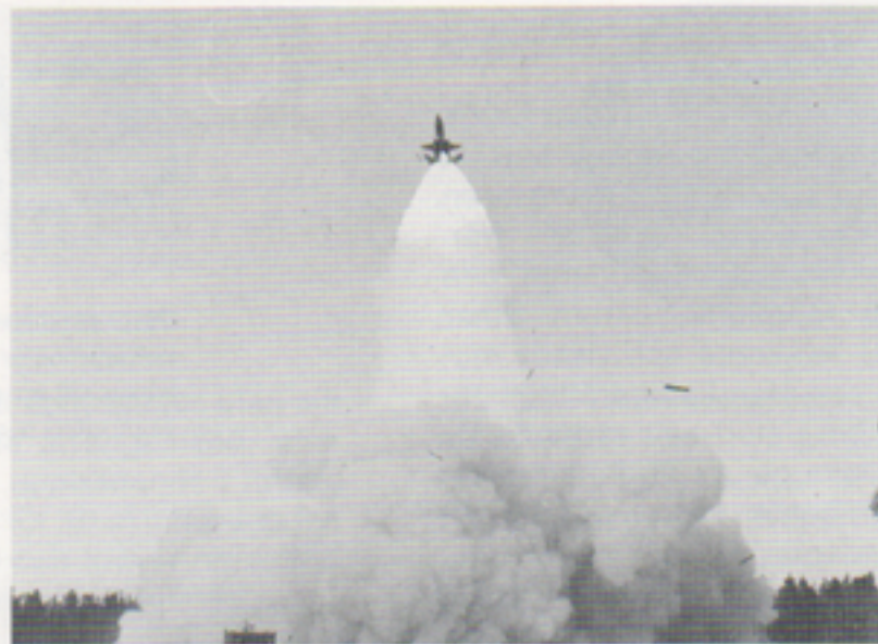
"Med ett enormt dån och i skyar av rök"