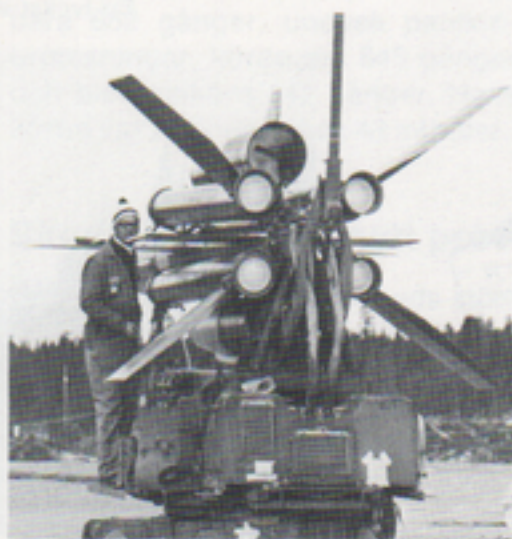
Klargöring av robotar. Ovan Birger, t.h. två grabbar ur förbandet