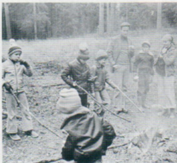
...fast det fanns ju dom som hellre grillade under mera "fältmässiga" former .....