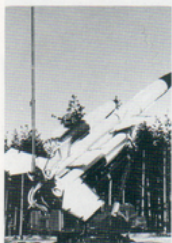
Robot 68 – Bloodhound – är en ståtlig med också effektiv pjäs

De gånger vi arbetade mindre än 12 timmar per dygn hade vi även tid med lite motion i en underbar natur som visade upp sina vackraste färger för oss – ibland satte den också krokben, med en del smärre skavanker som följd – samt att bilda SBK (Storforsens Bastubadarklubb) som sammanträdde under en timma varje dygn efter avslutad tjänst.