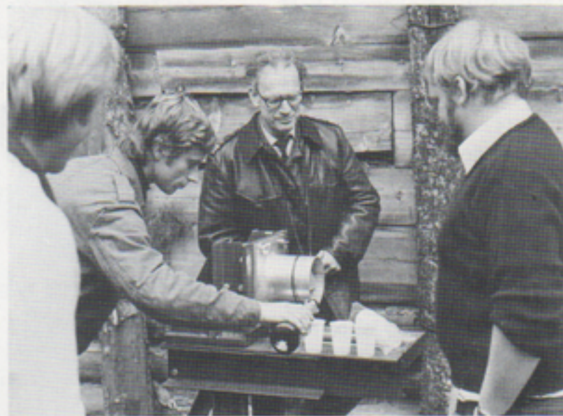
Ett lyckat skott firas med champagne

Tystnaden bryts av ledningscentralens meddelande: Målet i luften. Nu vidtager en kort stunds väntan på nedräkning till avfyring. I högtalaren hörs ett sprak och skjutledaren meddelar: Nedräkning börjar 5, 4, 3, 2, 1, eld. Med ett enormt dån och i skyar av rök och eld försvinner roboten mycket snabbt upp mot den mörkblå himmelen. Om du nu har goda ögon och blicken riktad på rätt ställe kan du långt i fjärran efter en stund se ytterligare en blix och ett rökmoln, vilket vittnar om att roboten avslutat sin "sista" färd. Dags att korka upp champagneflaskan!