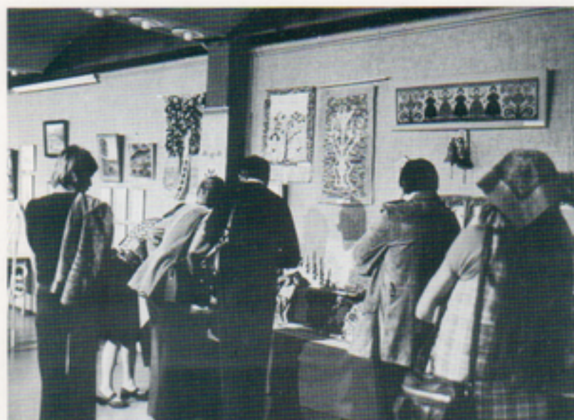
Telubanställdas egna produkter på konstutställning väckte stort intresse

Som framgick av referat i föregående nummer av Telub-Nytt var den nybildade Telub Konstklubb snabb med att komma igång med sin första utställning. Redan den var en succé både för klubben och för konstnärinnan.