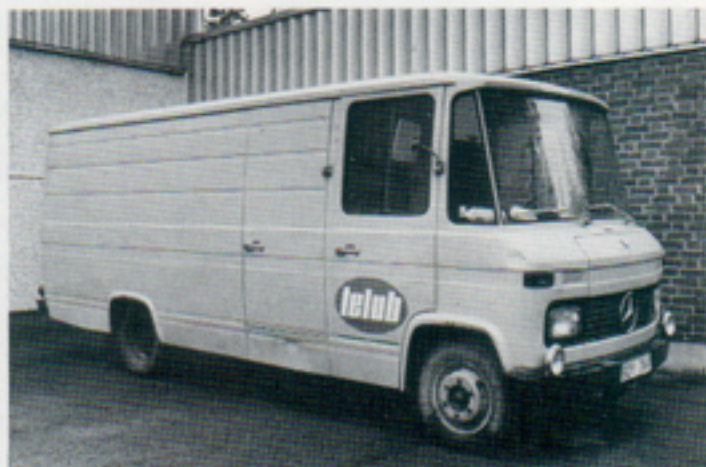
Installationslagets vagnpark. T.v Land Rover (m mobiltelefon) och personalvagn. Ovan arbetsvagn — en rullande verkstad med bl. a elverk. Ciceron är Östen Wennberg.