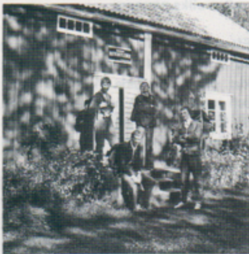
Nynässtugan, ledens första etappmål och vårt slutmål den här gången.

första etappmål, Nynässtugan, ett gammalt torp som renoverats i syfte att ge härbärge åt vandringsentusiaster. Här måste tyvärr vandrigen avbrytas, längre än så hade vi inte planerat att gå den här gången. Alla var dock överens om att denna tur måste upprepas.