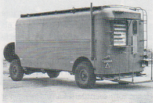
Telefonstationsvagn 3, föremålet för vårt besök.