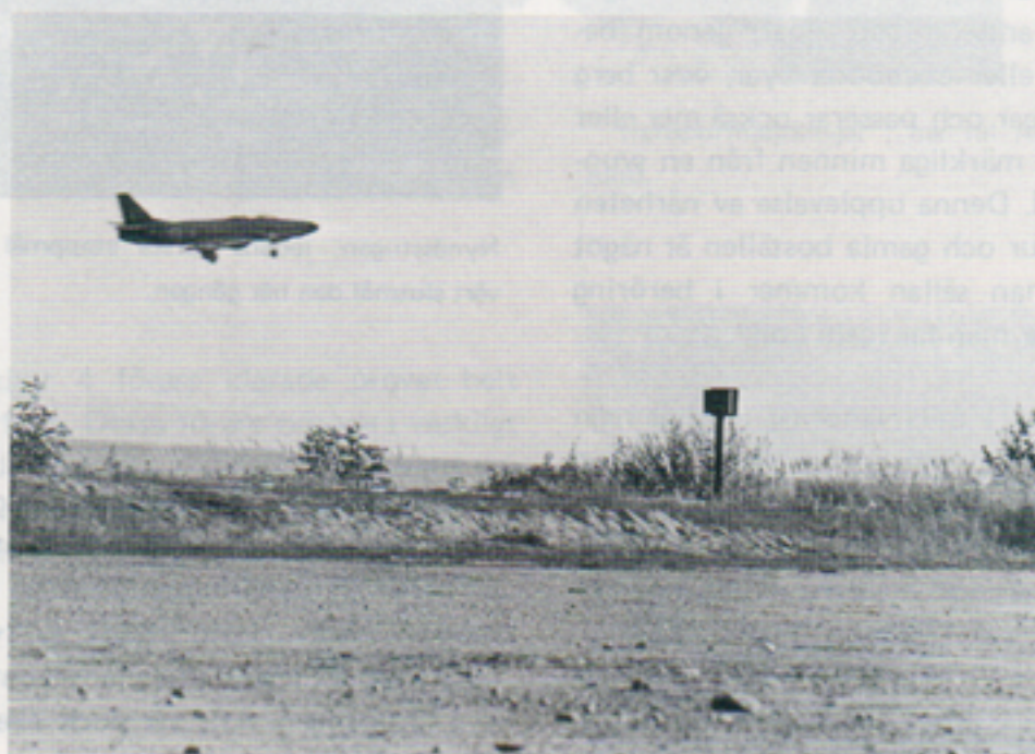
Karlsborgsflygarna höll på att spräcka våra trumhinnor med sina eviga starter och landningar.

Hoppas detta givit en liten bild av vad teknikinformations beskrivningsingenjörer sysslar med, jag tänker då speciellt på alla Er som inte tidigare känt till avdelningens existens. ■