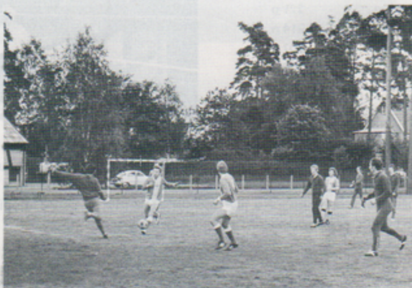
Och här fastställs slutresultatet till 4-0.