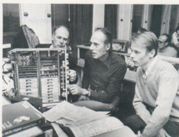
Aha, fel inställningskod!

Kursen, som omfattar 9 dagar, innehåller 5 dagars teoriundervisning samt 4 dagars mätövningar och felsökning.