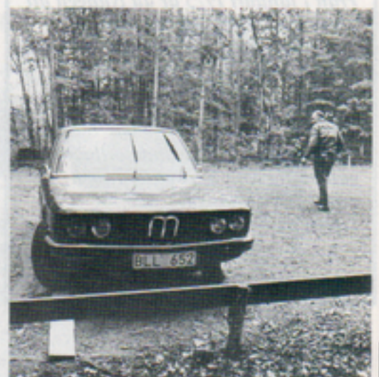
Vem kan det väl vara, som just fått kontakt med sitt högra framhjul?