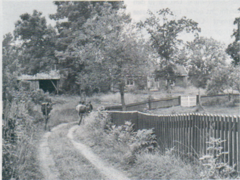
Gamla byar och boställen upptäcker man sällan från bilen. Här går leden genom "Döderhultarns" födelseby.

Efter två mils vandrande och många upplevelser rikare nådde vi ledens