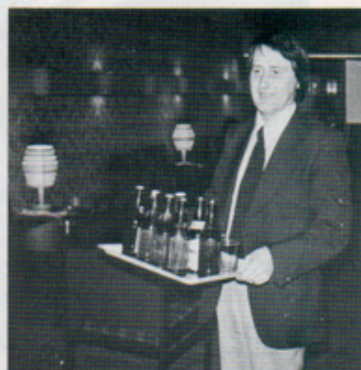
Öl och smörgås bjuds deltagarna på. TTK ordförande förser sin grupp.