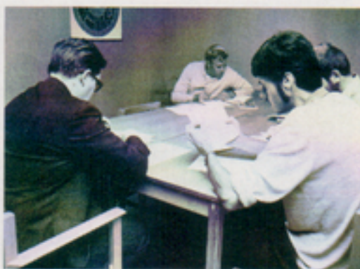
Kurs i arbetsmiljö våren 1971. Grupparbete.

Hos oss ökar medvetandet om utbildningens stora betydelse och en allt större andel av våra resurser satsas på utbildning. Vi arbetar med rent produktinriktade kurser för att klara en apparat, ett system eller en anläggning. Inom området allmän teknisk utbildning anordnar vi tillsammans med kursarrangörer utbildning för att bibehålla och höja den generella tekniknivån. Framst med tanke på att många av oss har externa kontakter har vi utbildning i bl a framställningsteknik. Sedan något år har vi också satsat på ledarskaps- och organisationsutve-