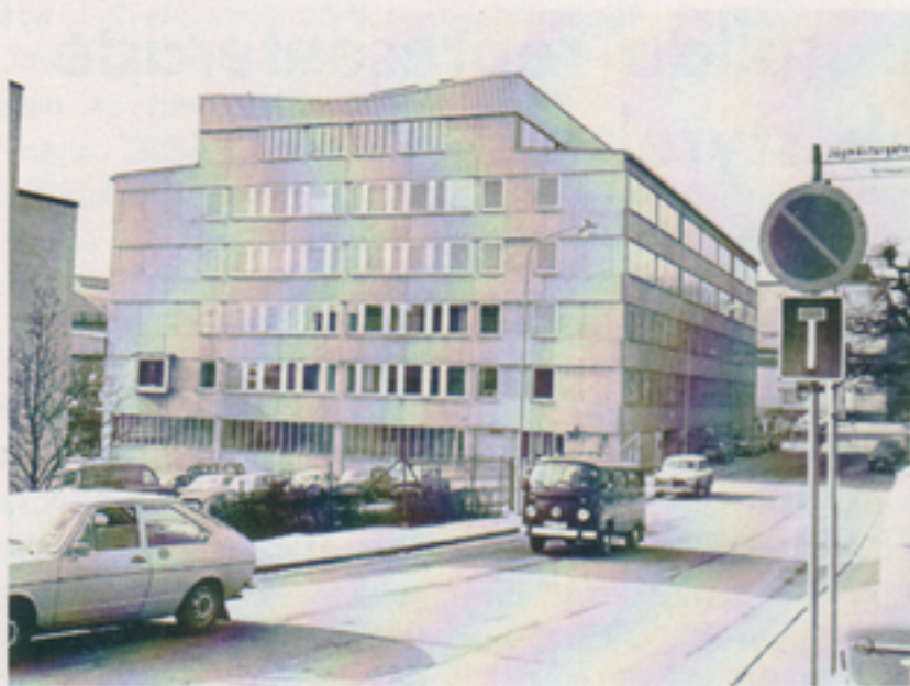
Huset nr 5 vid Midskogsgränd. Här har huvuddelen av Stockholmskontoret samt RS samlats i nya lokaler (våningen närmast under takvåningen)

Begrepp som "gott samarbete på kamratlig grund" med kunden ställes ofta liktydligt med "svansviftning" och