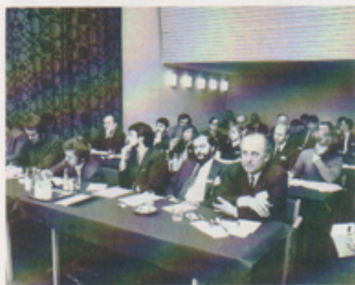
Presskonferensen lockade många redaktörer, huvudsakligen från fackpressen men även från ett antal dagstidningar.

Telub genomförde bl a därför under år 1972 för första gången en metodisk och omfattande marknadsbearbetning i form av en större presskonferens i Växjö, annonsering och utsändning av reklamtryck i flera omgångar. Resultatet blev väl inte vad många hoppats. Men vi kunde konstatera en ökad kännedom om Telub. En i och för sig nödvändig förutsättning för att få kontakt med kunder på den civila marknaden. En försäljningsavdelning började byggas upp för den nödvändiga bearbetningen av presumtiva civila kunder.