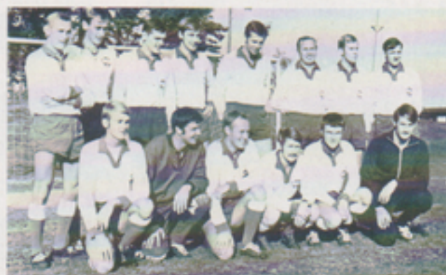
holmslaget t v, Växjölaget t h. Bilderna tagna vid triangelmatchen 1969.