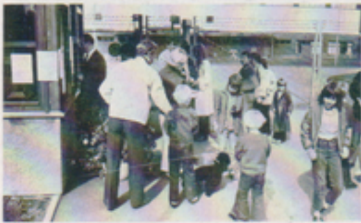
1000 starter blev det inte, men finaldagen blev det i alla fall en stor uppslutning. Bilden från starten vid vaktstugan.

Under 1971 gjordes ett allvarligt försök att locka ut många människor under rubriken "10 aktiviteter – 1000 starter". Ett antal kvällar ordnades varannan gång promenad 5 km, varannan cykling 10 km. Det hela avslutades med en tipspromenad under en lördagsförmiddag. Så många starter som 1000 blev det nu inte, men bortemot 500 var inte så dåligt ändå.