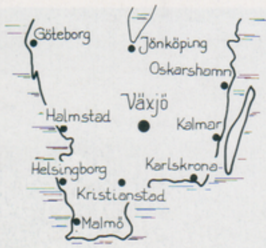
Växjös geografiska läge var gynnsamt

Lokaliseringen i Växjö motiverades dels av det geografiska läget i förhållande till försvarets förband, dels av arbetsmarknadsskäl, men det slutliga beslutet – Växjö, i konkurrens med några andra orter – var ett resultat av kraftfulla insatser från den kommunala ledningen i Växjö.