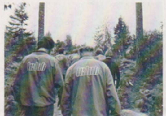
Telub-overallen – en praktisk klädsel, som dessutom visar att "Telub rör på sig".