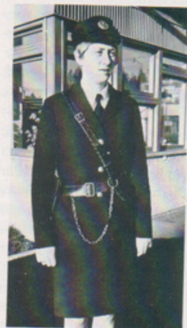
Redan i ett tidigt skede kom våra kvinnliga väktare i tjänst vid vaktgrindarna i Växjö (bilden t h) och i Risinge. Sedan hösten 1972 svarar kvinnliga väktare också för receptionstjänsten (bilden t v)