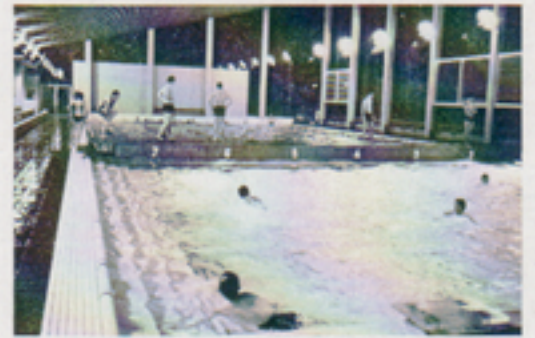
Vi hade en trevlig tid i simhallen så länge vi fick vara ensamma.