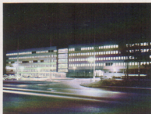
Året 1972 stod den nya, väl tilltagna, byggnaden färdig. Men vi växer och nya byggen är redan på gång.

Vi var redan då trångbodda, varför nya lokaler måste skaffas. Olika alternativ prövades för att lösa lokalproblemet dels på kort sikt genom förhyrning, dels på längre sikt genom nybyggnad. Den slutliga lösningen innebar att publikationssektionen under nära två års tid tillfälligt lämnade Ljungadalsgatan för att arbeta i förhyrda lokaler inne i Växjö. Nytt kontor och en ny verkstad uppfördes för att – som vi bedömde – trygga vårt långsiktiga behov. Och i slutet av år 1972 kunde publikationssektionen återföras till fadershuset, då de nya byggnaderna stod färdiga.