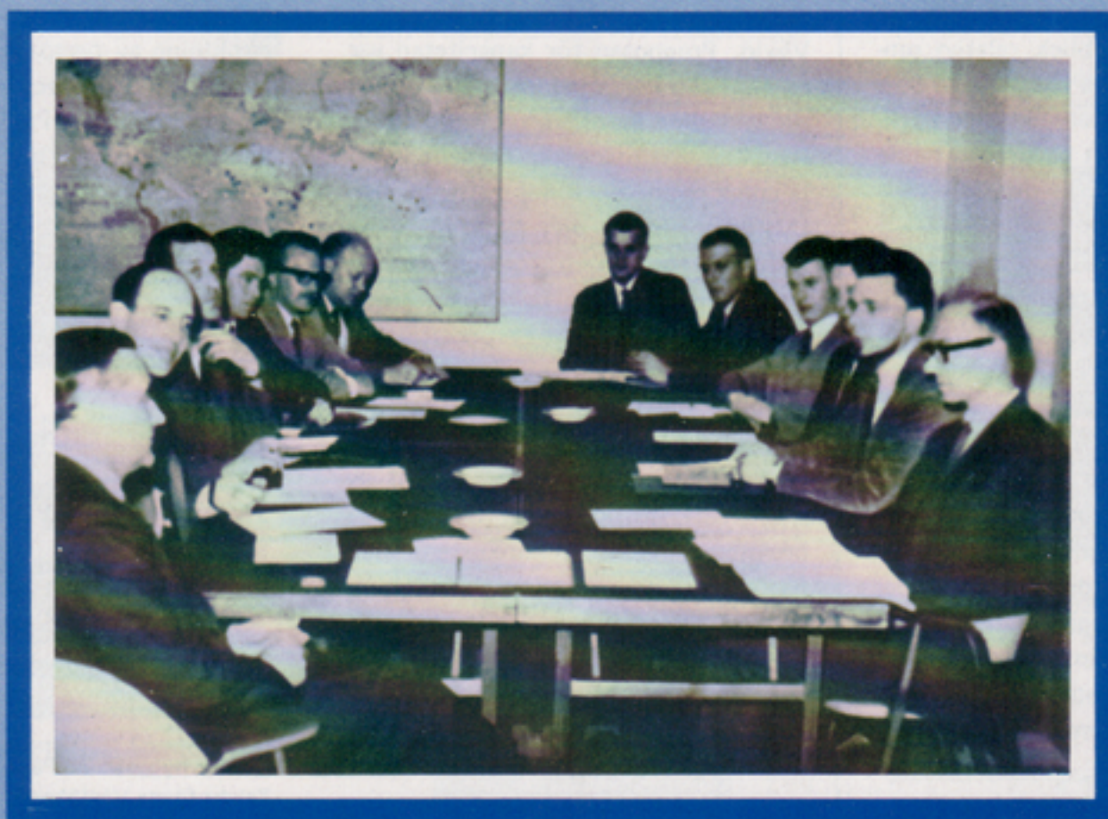
Telubs första företagsnämnd. Det första sammanträdet ägde rum den 22 juni 1965.