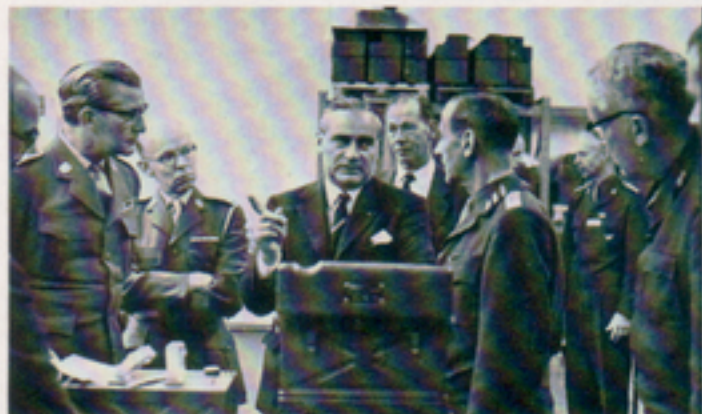
Representanter för den danska hæren med arméchefen, generallöjtnant Blixenkroné-Møller i spetsen, gästade företaget den 9 oktober 1968. Gästerna åtföljdes av den svenske arméchefen, generallöjtnant Göransson.