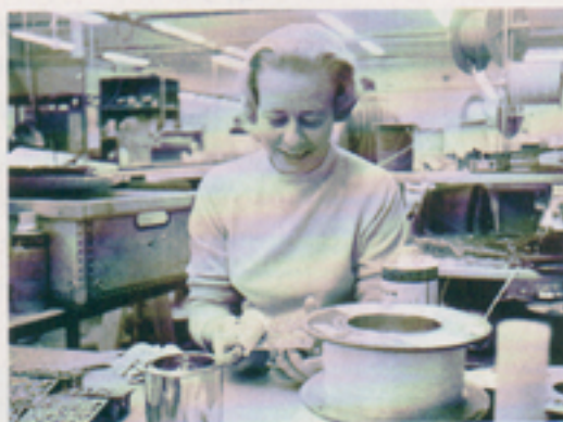
FCPF eller Metall – det var den stora frågan.

skulle gälla för företagets verksamhet. Man enades också om att ha två verkstadsklubbar, en i Växjö och en i Risinge. Antalet medlemmar i verkstadsklubben i Växjö var då 17, vilket innebar en 100 %-ig anslutning.