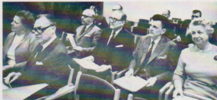
Den 17 mars 1969 besöktes Telub av en grupp riksdagsledamöter. Deltagarna ville genom personligt besök informera sig om verksamheten vid industrier med statlig anknytning.