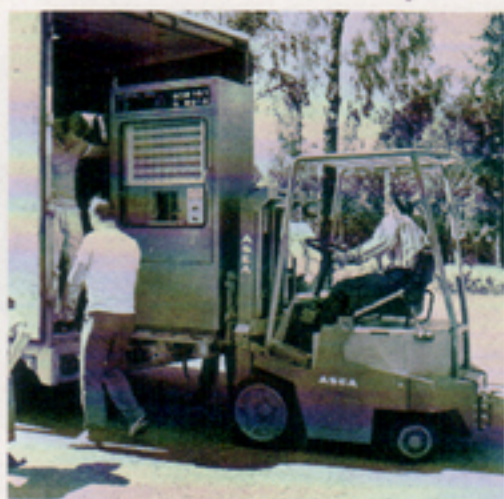
Styrskåp för SMT var en av våra tidiga produkter på legosidan. Bilden visar den första leveransen.

Det var dock önskvärt att för att säkerställa bolagets positiva utveckling underhållet av försvarsmateriel borde kompletteras med i första hand underhåll av civil telemateriel. Så startade 1968 det regionala teleunderhållet, dock inte utan ekonomiska svårigheter. För att få ytterligare kompletteringar av verksamheten togs beställningar 1969 på tillverkning av teleapparater. Vi hade ju inte någon utvecklad speciell försäljningsorganisation utan ett stort antal medarbetare var sysselsatta med att "ragga hem jobb" som det heter.