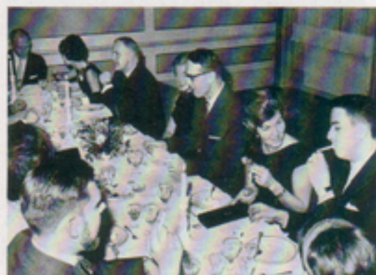
Telubs allra första personalfest avhölls på Stadshotellet i januari 1965.