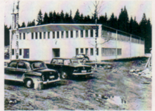
Vårt första bygge i Växjö, nuvarande "Byggnad F" inrymde till en början både kontor och verkstad.

Vi kunde inte vänta på resultatet av de utdragna ramavtalsförhandlingarna för igångsättningen av kontors- och verkstadsbygget. På Telubs egna bedömningar beslöt styrelsen i början av 1965 att bygga huvudanläggningen för totalt 400 anställda, 180 arbetare och 120 tjänstemän. Först i juni 1965 skrevs ramavtalet under av KFF och Telub, men det gav oss ingen större garanti för framtiden. Vi hade invigning i september 1966 med bland annat försvarsministern närvarande. Vi tyckte vi hade fått en fin och funktionell anläggning och kunde samla ihop våra medarbetare som varit spridda runt stan. Det många gånger kärva arbetet med att få militära beställningar och en underhållsmässig strukturfördelning av telematerielen hade pågått. Orderingen hade ökat, antalet medarbetare stigit. Utbildning av telereparatörer och telemontörer hade ordnats i samarbete med yrkesskolan i Växjö.