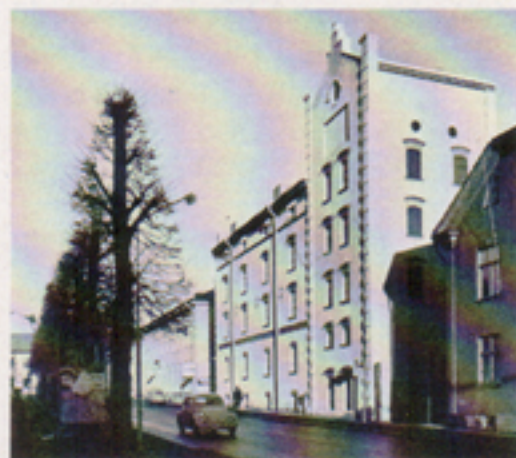
I fd Bayerska bryggeriet i kvarteret Munken tillbringade publikationssektionen en tvåårig exil.

Under samma år upphörde vi med kommunikationsradioservice från RS-kontor. Denna verksamhet hade inte varit möjlig att utveckla på planerat sätt. Telub skulle i stället satsa på att bygga upp resurser för regional service på kvalificerad elektronik inom områdena datorer med kringutrustning, industriell elektronik och medicinsk elektronik. Och detta har sedan genomförts enligt intentionerna, så att bolaget i dag har fasta servicekontor på 12 platser i Sverige och dessutom i huvudstäderna i våra grannländer.