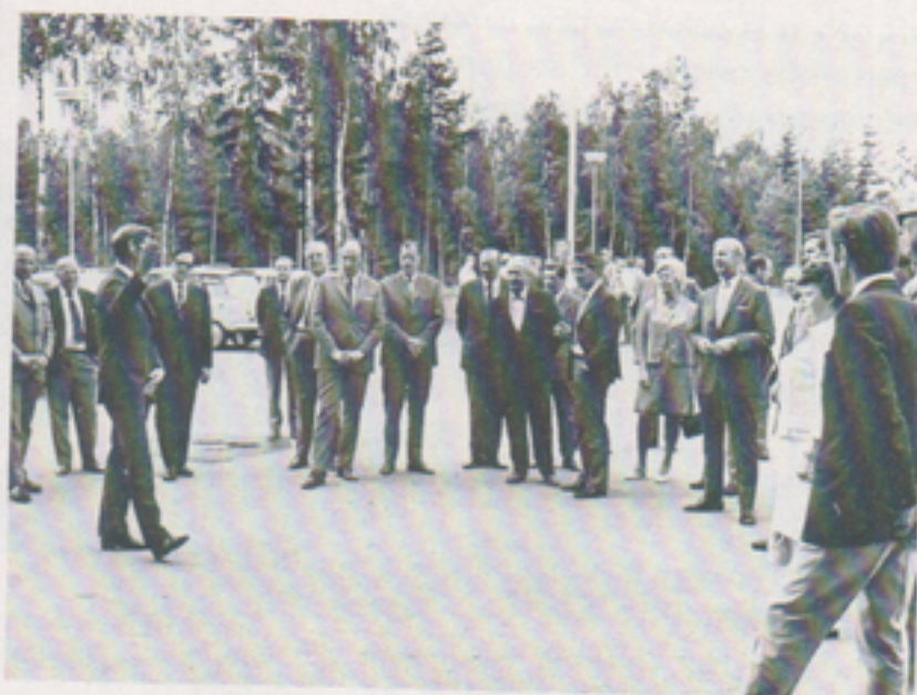
I samband med en studieresa i länet besökte riksdagens inrikesutskott företaget den 10 juni 1971. Med på besöket var också representanter för landstinget.