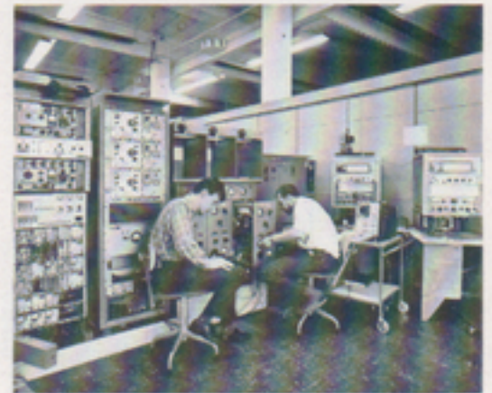
Renovering av Ra 620, ett av våra tidiga jobb som följde med vid inflyttningen i nya verkstaden.