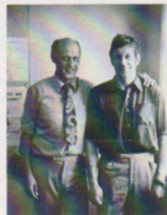
Två svårslagna kämpar inom tennisen.

Även i Smålandsserien har ett lag varit med. Här lyckades laget 1971 nå en förnämlig andra plats i div 1.