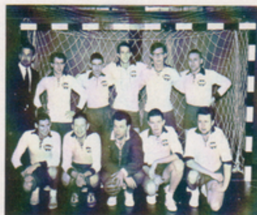
Det första handbollslaget.

Först 1971 vände lyckan. En andraplats i serien medförde uppflyttning till div 1. Där höll man sig kvar i två år. Efter ett nytt gästspel i div 2, som laget vann utan poängförlust, är man nu åter i div 1.