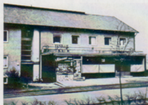
I denna byggnad vid Pär Lagerkvists väg var Telubs första Växjökontor inrymt.

Första tidens arbete var förhandlingar med olika myndigheter, planering och anställning av personal och med kontakter mest i Stockholm. Vi hyrde kontor i då nya Philipshuset på Lidingövägen, men vi hade också hyrt ett kontor på Pär Lagerkvists väg i Växjö.