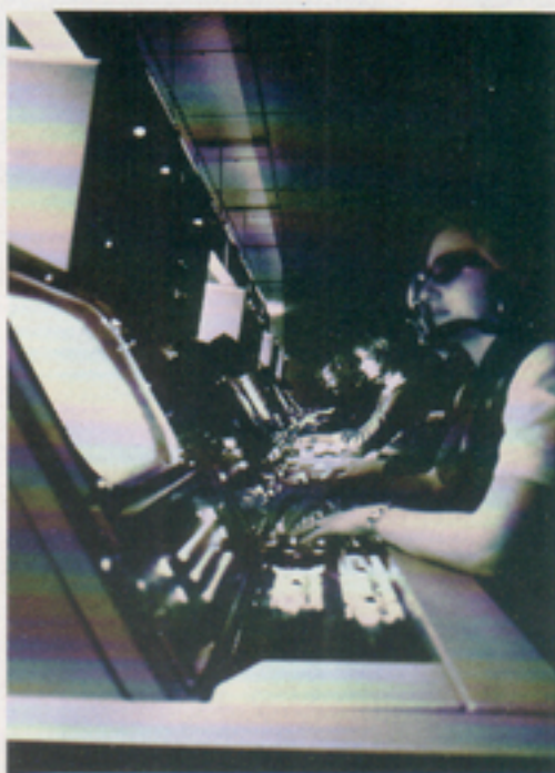
Övertagandet från SRA av drift och underhåll i en luftförsvarsanläggning var en viktig händelse. Det var i det sammanhanget våra nuvarande Hässleholmskollegor blev "Telubare".

Bland större händelser som inträffade under 1960-talet tycker jag det är värt att nämna avtalet med flygförvaltningen och SRA om övertagande av