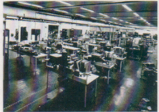
Lokalerna byggdes med fria ytor för att möjliggöra erforderlig anpassning.

Från och med inflyttningen i september 1966 har Ljungadalslokalerna tjänat verksamheten bra och i stort sett medgivit all erforderlig anpassning.