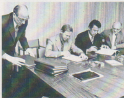
Ett viktigt ögonblick i Telubs historia. Avtalet om leveranser av fordonsvägar till jugoslaviska staten undertecknas i Växjö.

Efter denna mycket summariska återblick på de gångna åren kan konstateras, att den militära delen av bolagets produktion alltfört är den betydelsefullaste men kanske inte alltid den mest uppmärksammade. Företaget måste även i fortsättningen sträva efter att behålla och gärna också öka sin militära marknad som ännu under lång tid är en förutsättning för vårt ökande civila engagemang. Utbyggnad för civil produktion måste ske koordinerat med strävanden att åtminstone behålla nuvarande volym för de militära kunderna. Totalt sett torde detta dock innebära en måttligare expansion än bolaget haft under de senaste tre åren.