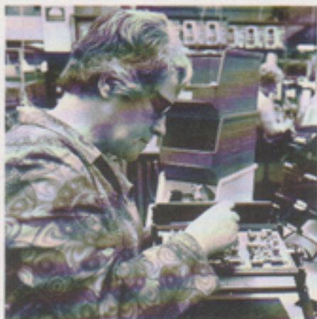
Ett tidigt arbete på legosidan var celloskopproduktionen för Linson. Bilden: lödning av kretskort.

Civiltillverkning av medicinsk elektronik från Linson var en nystartad produktion till vilken knöts stora förhoppningar, men som också krävde stora insatser, både personella och materiella. Tekniska avdelningen var under stark utveckling och behövde större utrymmen.