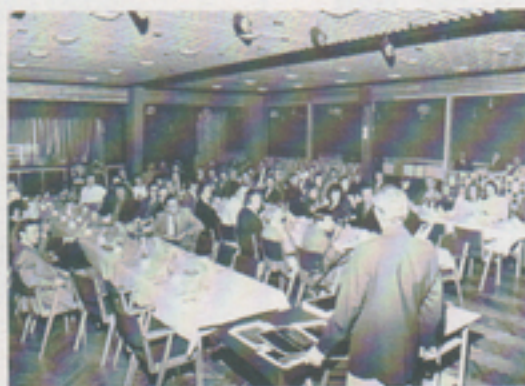
Företagsaftnar ordnas i företagsnämndens regi. Bilden från Polketten, Folkets park, 1973.

Under de senare åren har vi också börjat lära oss att det s k partsförhållandet på arbetsmarknaden och lokalt inom företagen i många fall kan ersättas med olika former av samråd. Men en bredare medverkan i arbetet med att ta fram vettiga regler för små och stora aktiviteter. Vår företagsnämnd har med åren utvecklats till ett informations- och diskussionsforum vars värde och resultat är svårt att mäta. Men jag är helt övertygad om att den institutionella form och stadga som vårt företagsnämndsarbete kännetecknas av är mycket viktig för vår verksamhet. Att vi sedan måste sträva efter att förbättra och ytterligare höja nivån är självklart.