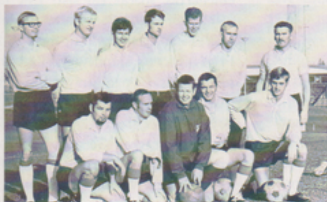
Två lag som kämpat många gånger både i olika serier och mot varandra till konditionens och kamratandans fromma. Hässle-