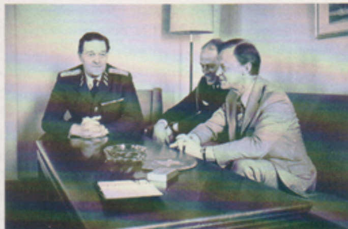
Den 13 juni 1972 besöktes Telub av ÖB, general Stig Synnergren. ÖB studerade särskilt Rb 68-verksamheten. Han ville också "bilda sig en allmän uppfattning om den kapacitet och det kunnande som finns samlat vid företaget".