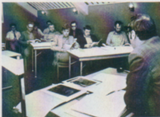
En kurs avseende arbetsmiljö anordnas i september 1971 på Hornsbergsskolan.

Vissa av dessa föreskrifter om skyddsombudens arbetsuppgifter, arbetsledarnas arbetsuppgifter i skyddsfrågor, skyddsingenjörens uppgifter m fl gäller fortfarande.