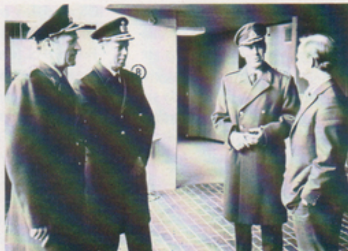
I år, närmare bestämt den 27 mars, var det dags för besök av militärbefälhavaren för Södra militärområdet, generallöjtnant Kari-Eric Holm. I sällskap med stabschefen och chefen för armésektionen besåg MB våra resurser inom olika produktionsområden.