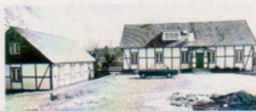
Ett trivsamt kontor fick TAH 1972.

Service av transmissionsutrustning. Ett moment i TAH jobb i den fasta anläggningen. →