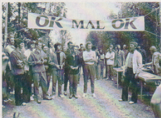
För andra året i rad vann robotavdelningen.