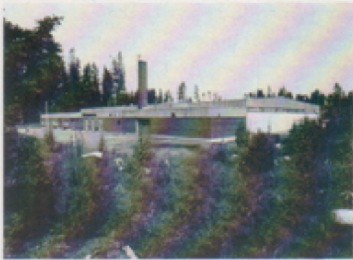
Sommaren 1965 var Risingeverkstaden klar och Rb 68-underhållet kunde börja.