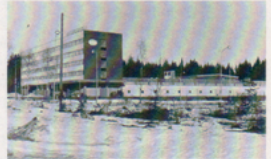
Hösten 1966 kunde vi flytta in i den, som man trodde, väl tilltagna byggnaden.