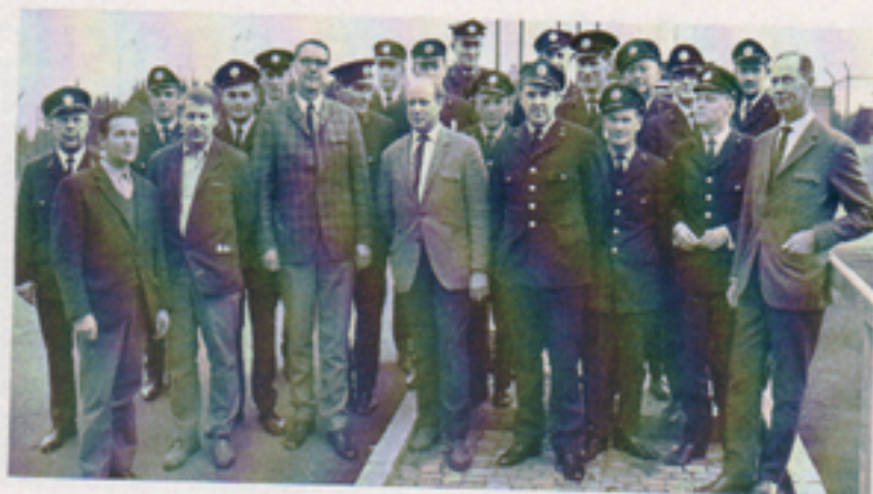
Våra väktare 1968–69 samlade tillsammans med drift- och säkpersonal vid Telub i samband med ett studiebesök.

Väktarna har visat god förmåga att sköta sitt jobb på ett effektivt men samtidigt smidigt sätt. Många är också "gamla i gården" nu. Att dessa känner en viss samhörighet med företaget framgår inte minst av att de då och då deltar i våra sammankomster och i den idrottsliga verksamheten.