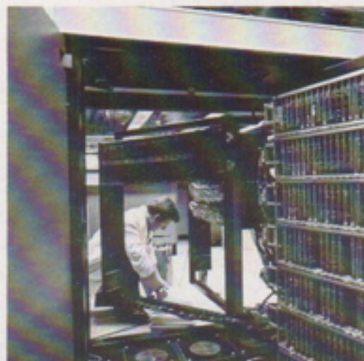
RS satsar på kvalificerad elektronik. Ett tidigt uppdrag var service av ICL-datorer för Trygg-Hansa i Stockholm.