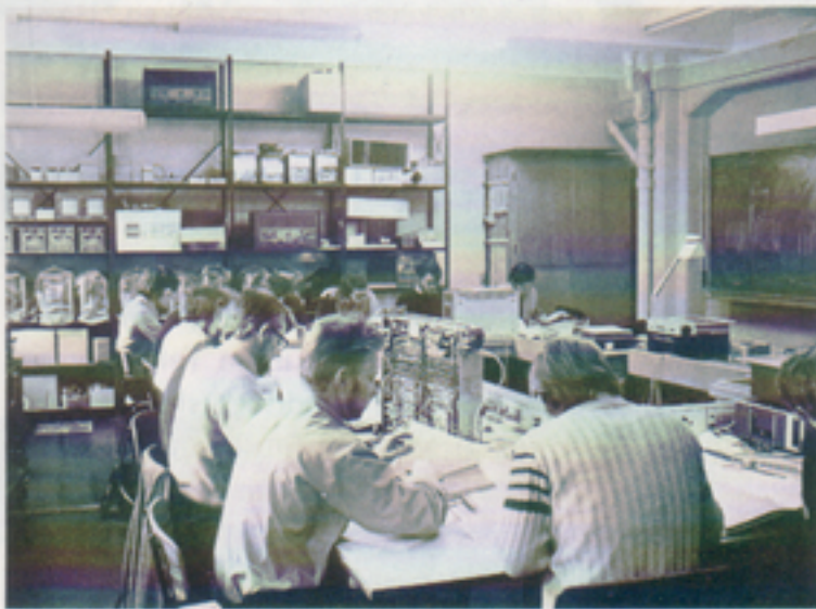
Här pågår "måleøvelser"

Lärarnas omdöme kan enkelt sammanfattas så här: "Tacksamt att vara lärare".