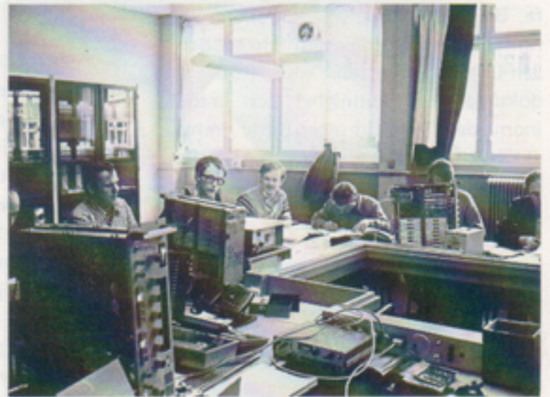
Felsökningen vållade inga större problem