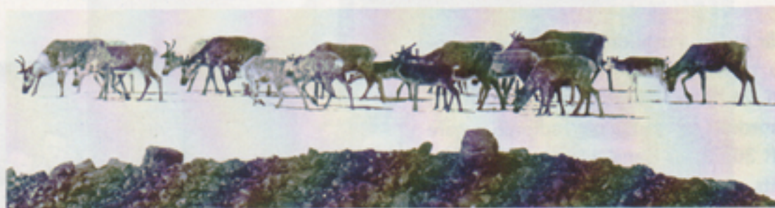
På Sylmassivets sluttning, nära norska gränsen, togs bilden av renfloken.

Inga irrfärder här inte som när undertecknad, med lika vilsen kompanjon, en stekhet sommardag för en del år sedan drog iväg från Abisko turiststation för att bestiga en efter vår bedömning lagom stor knalle. Iförda träningsoverall, fotbollsskor, släpades på en vanlig bag, började vi klättringen uppför, men konstaterade snart att knallen bara blev högre ju längre upp vi kom. Efter 4-5 timmars kämpande var emellertid ber-