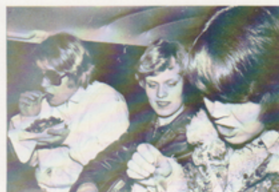
Lite energipåfyllning behövs efter allt slitet