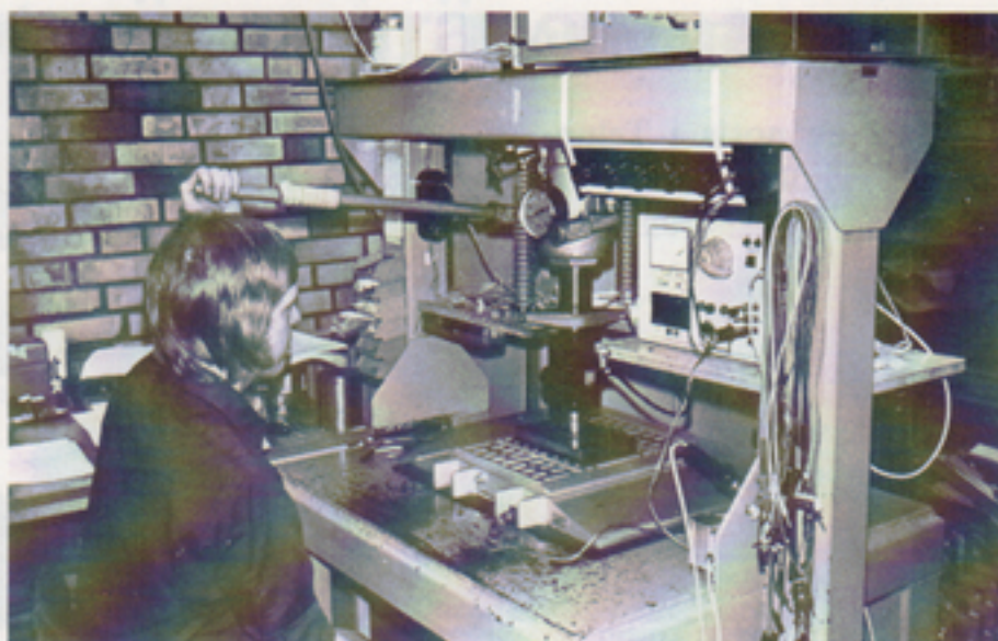
Ingvar Gustavsson slutkontrollerar vågplattorna i en specialbyggd provutrustning.

— Vi har gjort ett prov-bygge åt vägverket. Det rör sig om plattformsvågar, som bygger på 40T-systemet. Det arbetet har också lett fram till en klarare definition av vad transportnäringsringen behöver för vägningsutrustning. Tendensen pekar klart mot sk terminalvågar, dvs vågar som på ett enkelt sätt också kan dokumentera den erhållna informationen — både när det gäller överlastproblematiken och kontroll av levererade mängder gods.