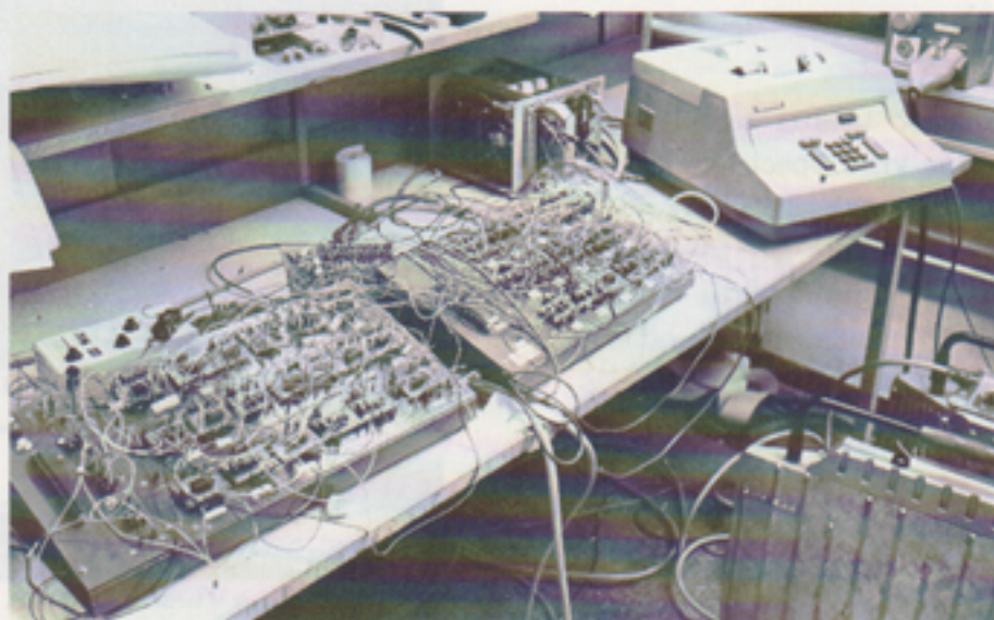
På utvecklingssidan har man det "snärjigt". Detta är en labb-koppling för Jugoslavienprojektet.

— Som sagt, vi har planer på att ersätta det befintliga 40T-systemet med ett terminalsystem. Den stora säljinsatsen kommer att ske under andra halvåret, och i viss mån också under maj-juni. Den totala försäljningen inom vägningssektorn beräknas uppgå till omkring 3 miljoner kronor, varav hälften på 10T/10T-G-sidan och andra hälften på de övriga vägningsystemen.