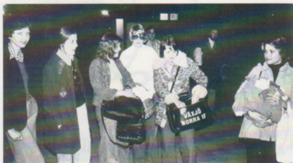
Huvuddelen av laget efter matchen. Inga sura miner här, inte!