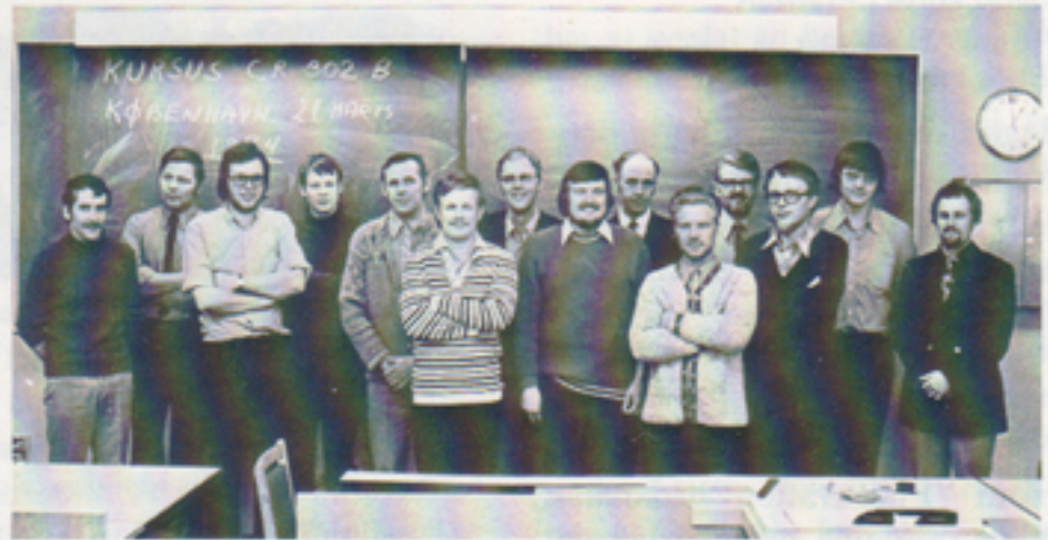
Nästan alla elever samlade.

Trots den språkbarriär som ju tyvärr finns även mellan grannländer, blev förståelsen ömsesidig. Elevernas intresse gick inte att ta miste på och det