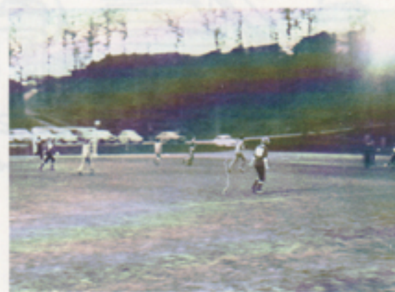
Men planen var så stor, så stor