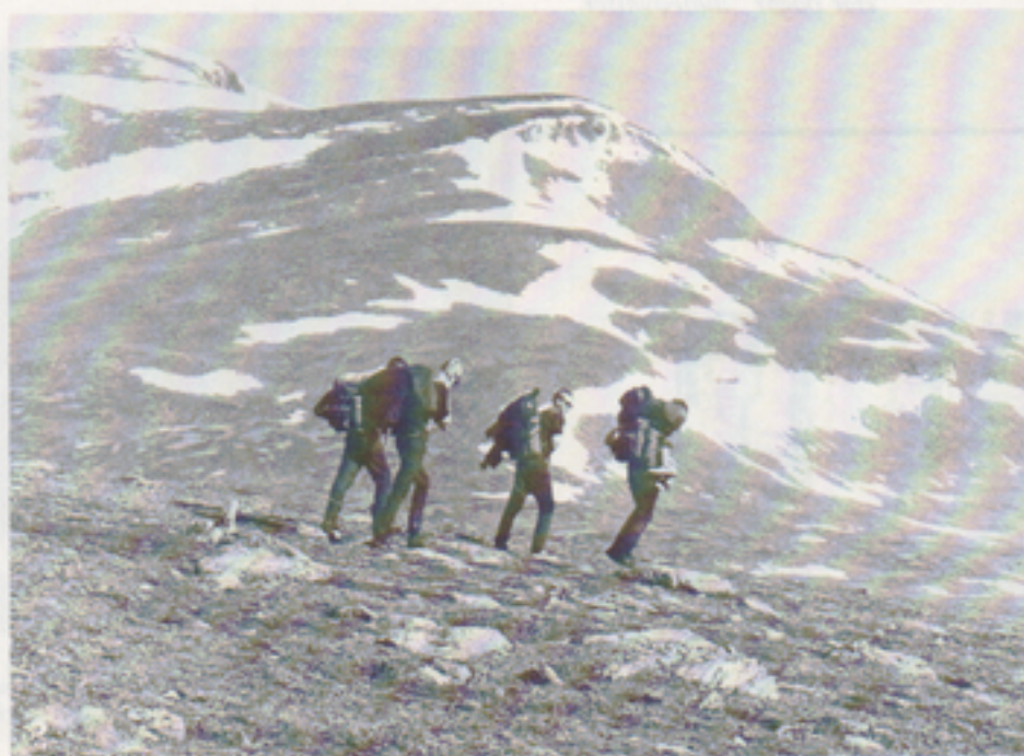
Vandring en julidag på fjället Gåsen i Jämtland.