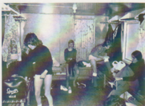
Tar vi det bara lugnt, så tar vi dom.

Till sist önskar jag som ledare för damlaget bara att fler av Telubs flickor ville vara med och känna den glädje och kamratanda som finns i laget.