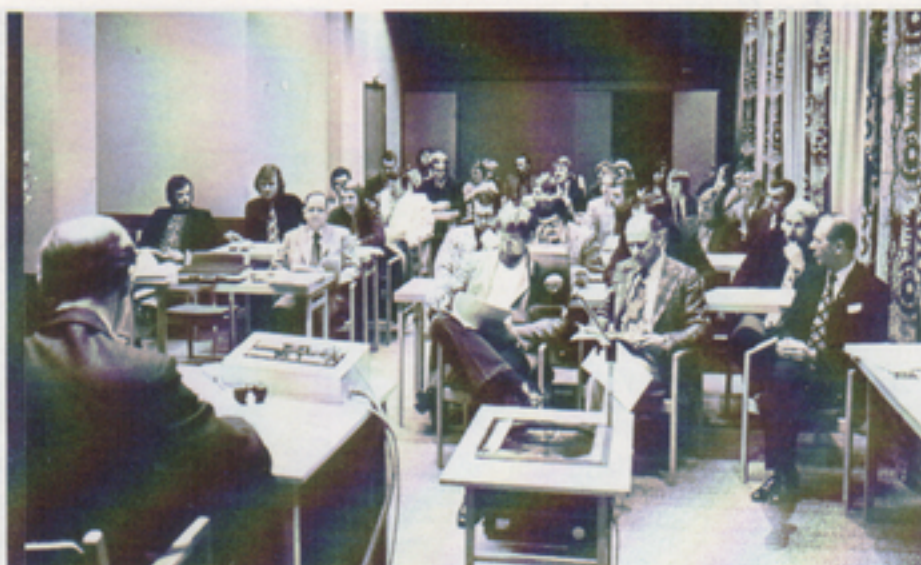
Filmsalen var i det närmaste fullsatt när den 10:de årsstämman öppnades – och fler intresserade stötte till efter hand.