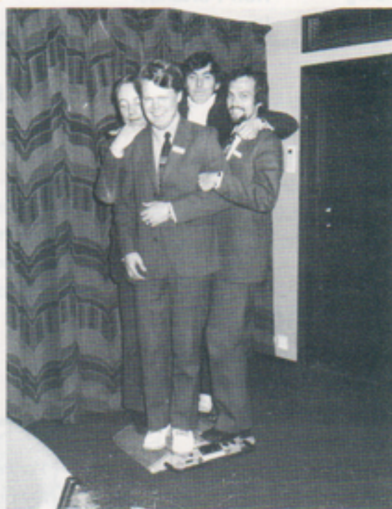
En informationskvartett från Asea-Atom, Stenberg-Flygt, Vattenfall och Försvarets sjukvårdsstyrelse provar fordonsvågen