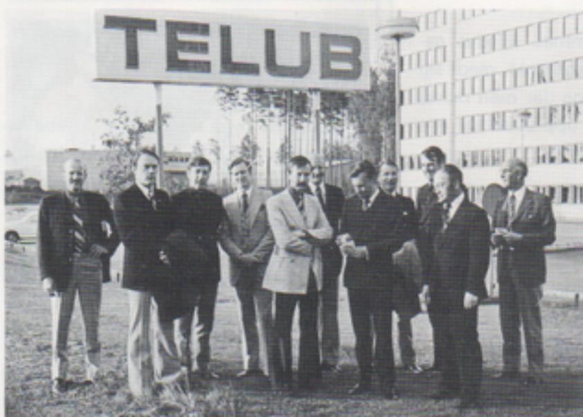
Torsdagen den 7 juni besöktes Telub av tygförvaltningskolans tygofficerskurs. Detta besök är numera tradition och ett utmärkt sätt att knyta kontakter och sprida förståelse för vår verksamhet.