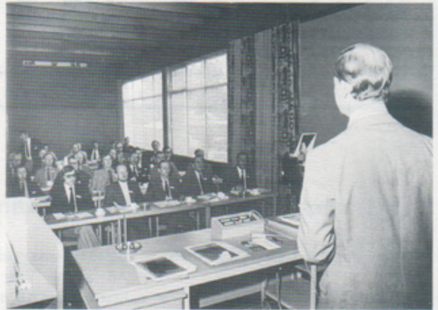
VD hälsar representanter för småländska industrier välkomna till detta första försök att lära känna varandra och de olika företagens produktion.

Det torde vara första gången ett sådant här försök till industrikontakt görs, i varje fall i våra trakter. Att gensvaret från deltagarnas sida var positivt kunde man inte missta sig på. Om detta initiativ skall få en fortsättning från andra industriers sida återstår att se. Det var i varje fall något som VD uttryckte en särskild förhoppning om då han avslutningsvis tackade de närvarande för visat intresse.