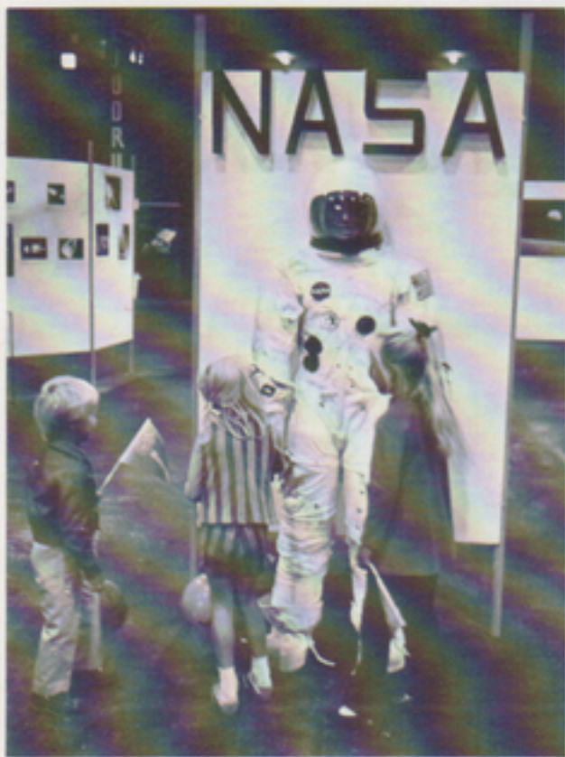
De allra yngsta svek Telub för att i stället passa på att hälsa på rymdfararen.

Som Telub-nytt kunde meddela i föregående nummer deltog företaget i »Kronobergsutställningen med Smålands Tekniska Mässa» den 2,9-5,9. 1971. Vårt inslag bestod av dels en monter i »Industrihallen», dels två robotar, placerade utomhus i anslutning till utställningsentrén.