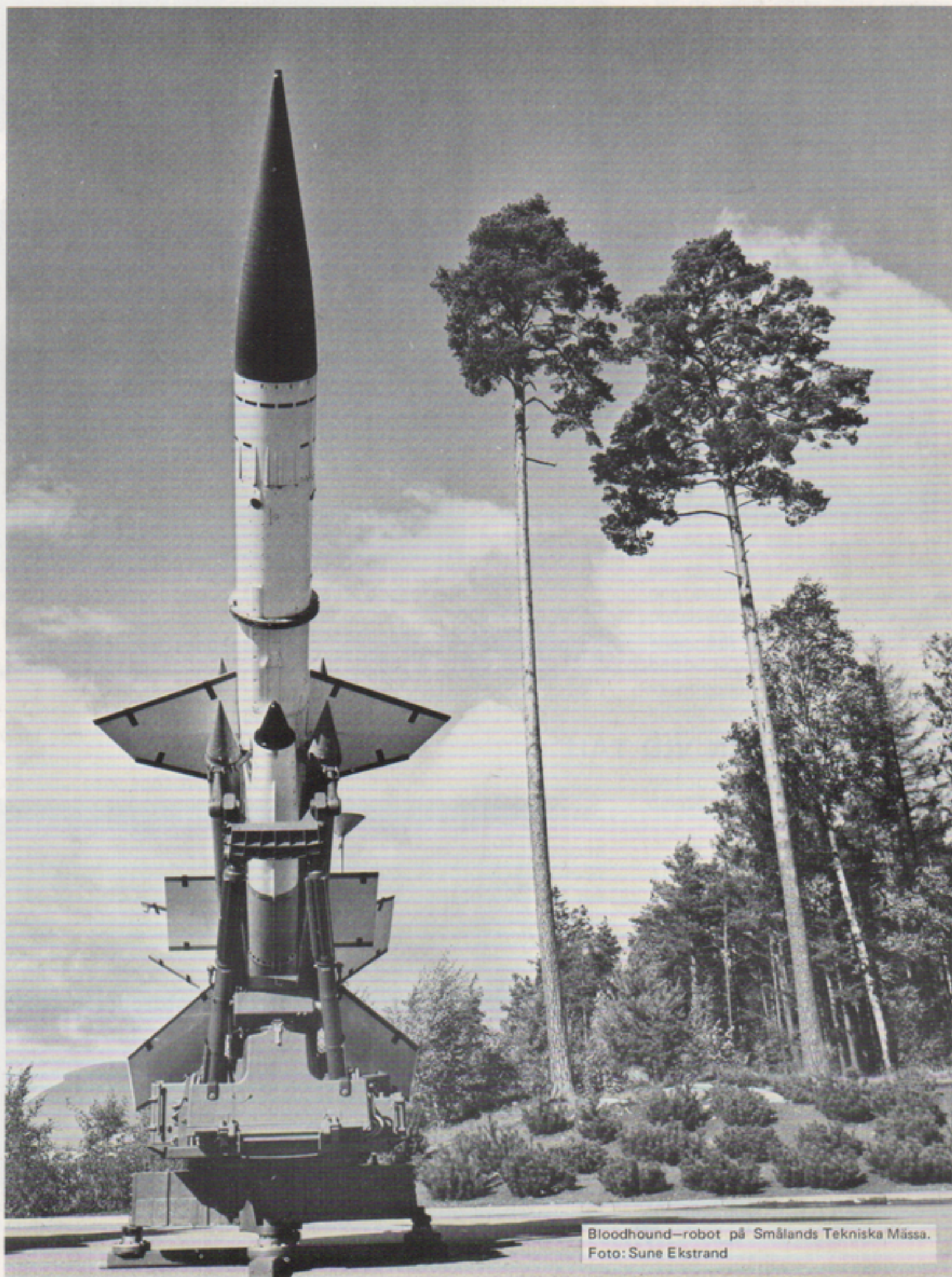
Bloodhound-robot på Smålands Tekniska Mässa.