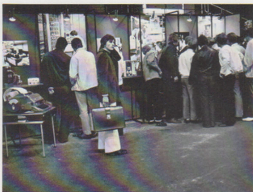
Telubs monter drog mycket publik, till stor del grabbar på väg ut i arbetslivet.