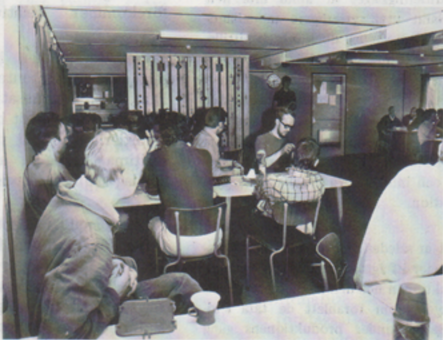
Äntligen har Risingepersonalen fått en trivsamt lokal, inte bara för måltider utan också för sammankomster.