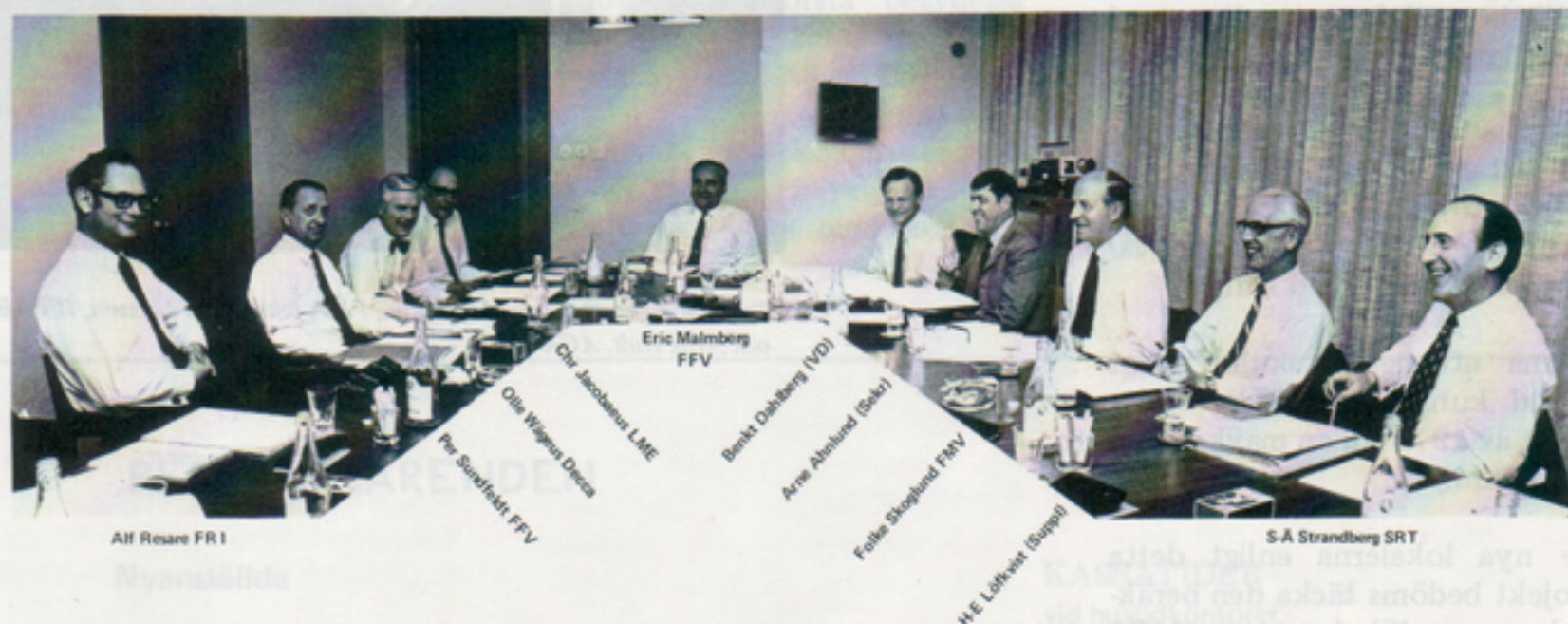
Aif Resare FR1