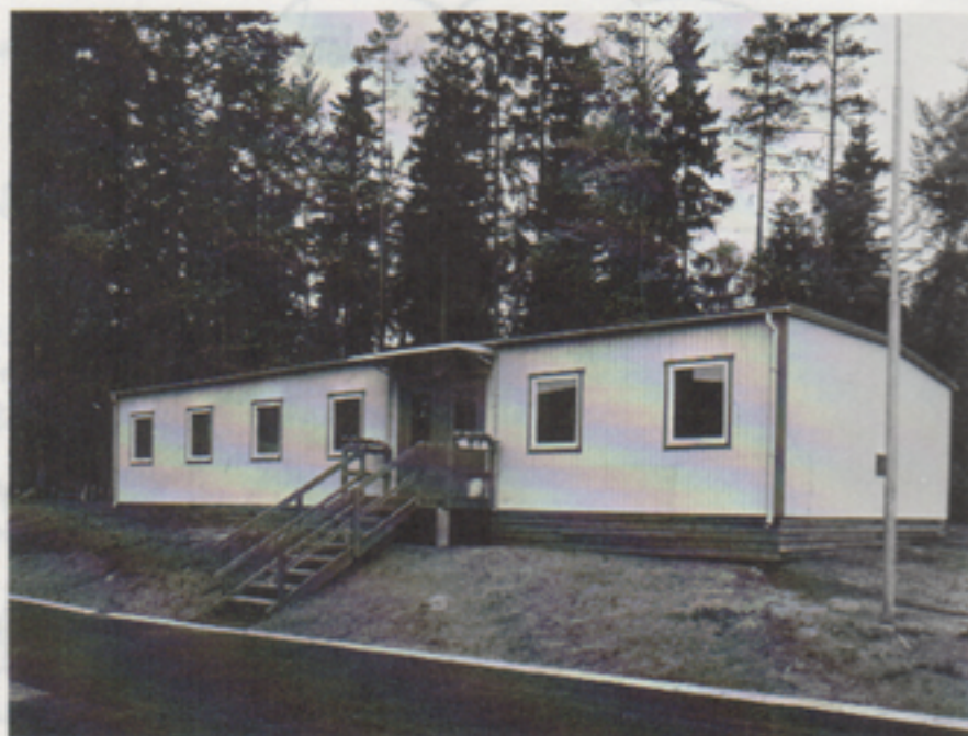
Den nya mässbyggnaden i Risinge.