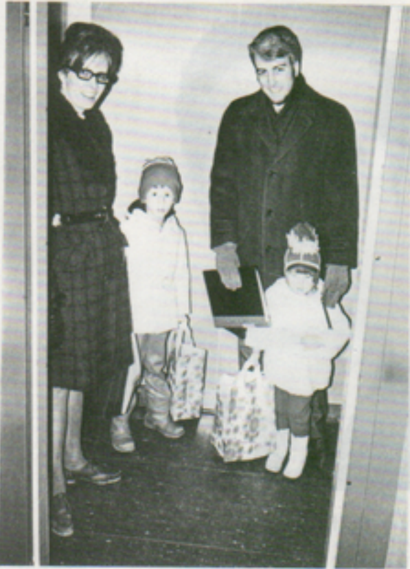
Sista »kvartetten» lämnar företaget – för säkerhets skull via hissen. Familjen Stenberg med julklappspåsar och sångarlagets nothäfte.