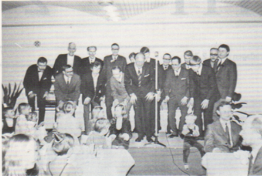
Telub Sångarlag gjorde en som vanligt bejublad insats. Här i en medryckande allsång med motionsinslag.