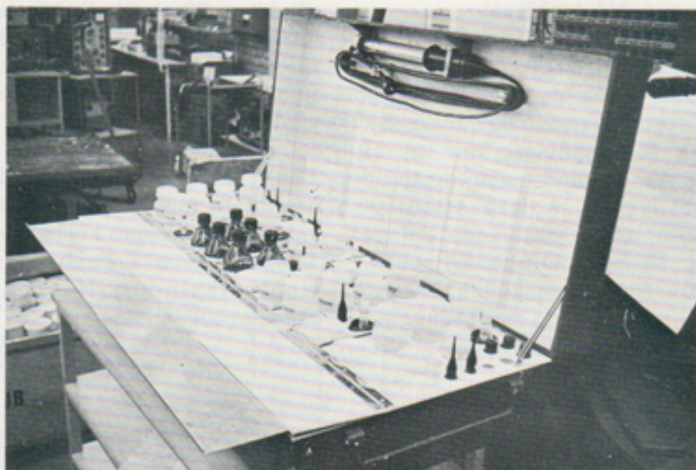
Reagenslådan är ett laboratorium i miniatyr, där de olika proven förbereds, t ex genom tillsättande av reagensmedel.

En frontlabutrustning består, som nämnts, av fem enheter: