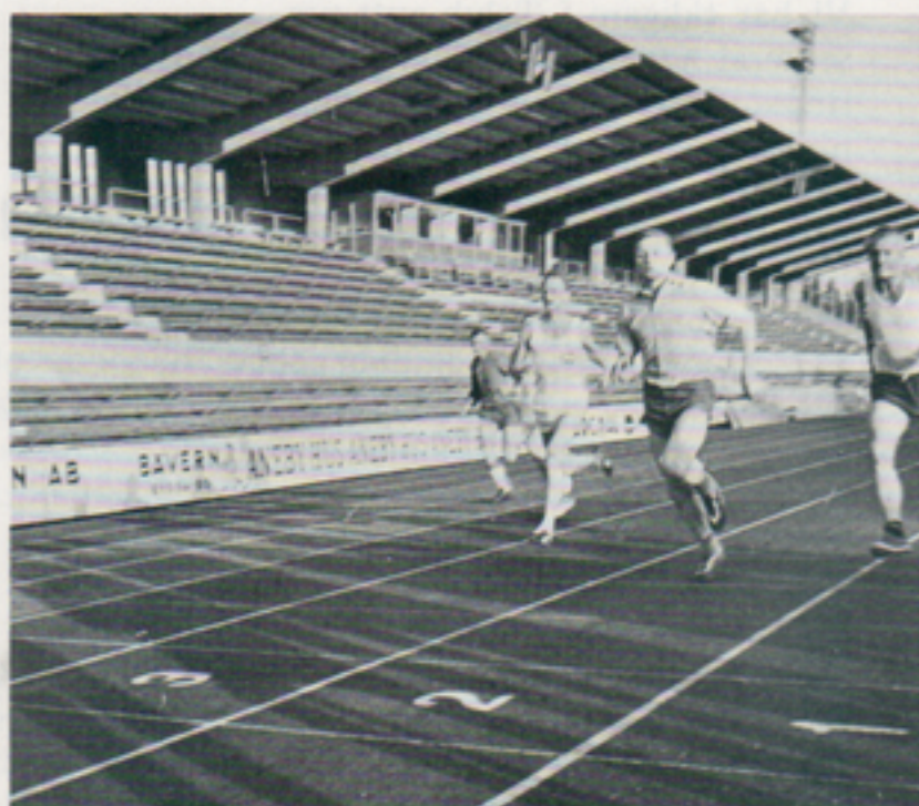
VD löper in som god 3:a.