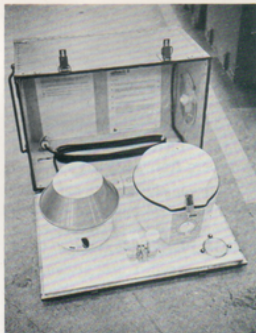
I centrifuglådan skiljs blodkropparna från blodvätskan, serumet, Denna vätska används oftast vid analyser.