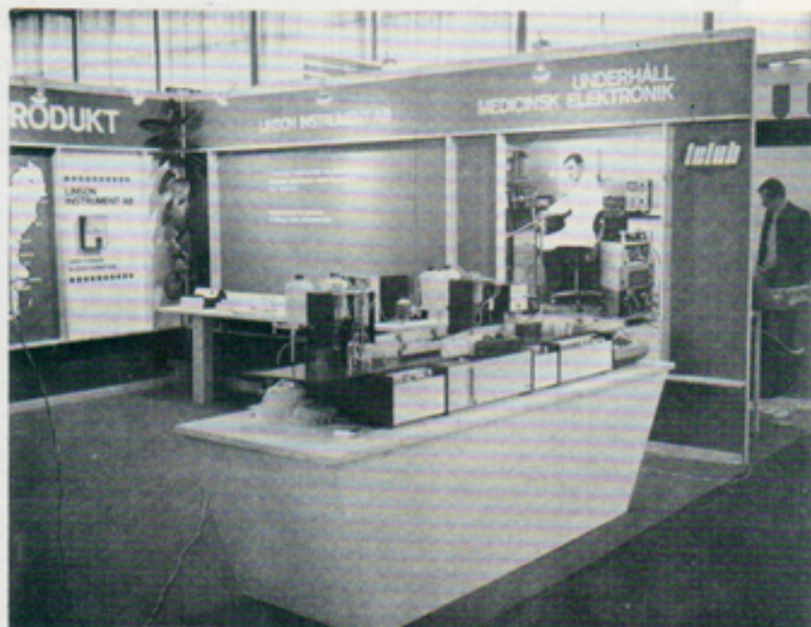
Från utställningen i Stockholm. I fonden Autolab.

Genom den nu framtagna utställningsutrustningen, som företaget avser använda även i fortsättningen, har goda möjligheter skapats att utåt visa våra resurser i större utsträckning än tidigare. Detta har bedömts som ett viktigt led i vår strävan att nå en större kundkrets inom den civila marknaden.