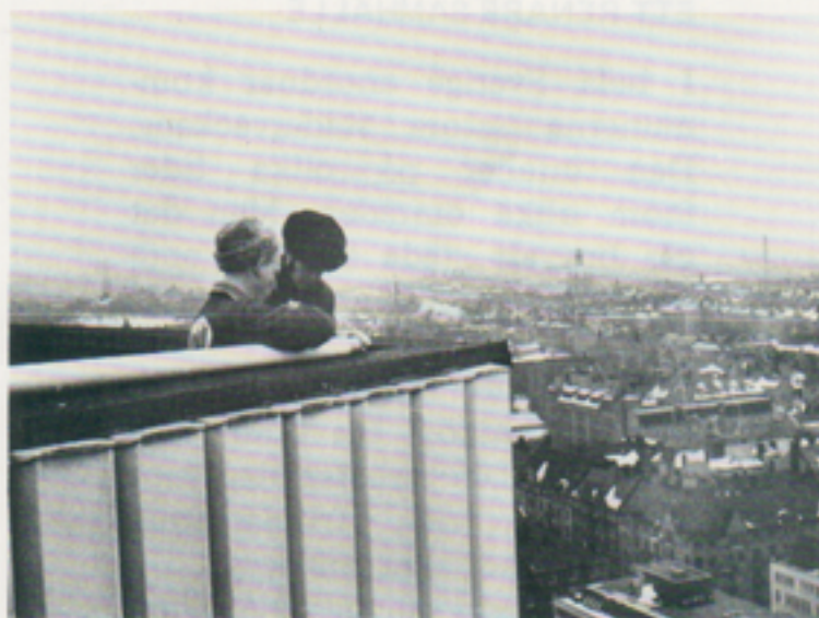
RSS pojkar kan inte klaga på utsikten. Dom är vana att jobba på höjder. Se artikel här bredvid.

»Jag tror det bara är bra att röra på sig. En nackdel var väl att det inte gick att hålla ihop med tjejen därhemma. Men det gör inget, det är redan en ny på gång».