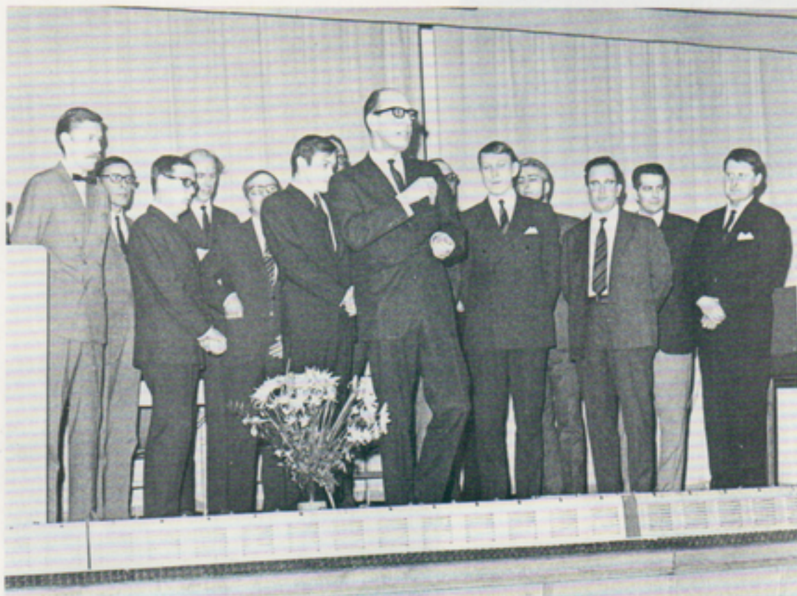
Telub Sångarlag – som vi hoppas få höra mycket mer av.

Den årligen återkommande företagsaftonen i företagsnämndens regi gick av stapeln den 16.4.