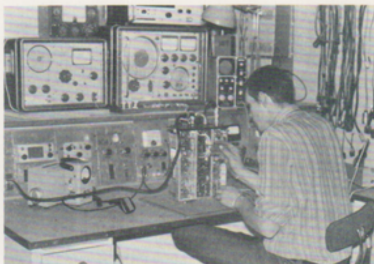
Ett praktiskt arbetsbord. Instrumenten är placerade på vändskivor för att kunna användas från två håll. Bilden visar service av AGA kom radio. Här servas också SRA, PYE, Link m fl. På motsatta sidan endast Storno.