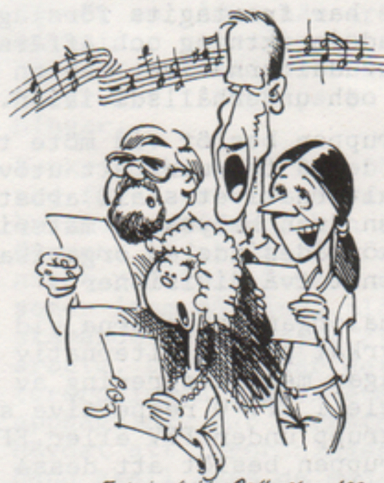
Tekning Krister Poffersson, IPS