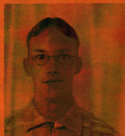
och Pär (som tidigare arbetat i Växjö)

ska etablera driften, förvaltningen och utvecklingen av systemet. Det kommer att bli en rad versioner och några varianter av ärendehanteringssystemet.