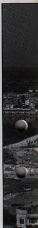
Ett blickfång Moskéns by