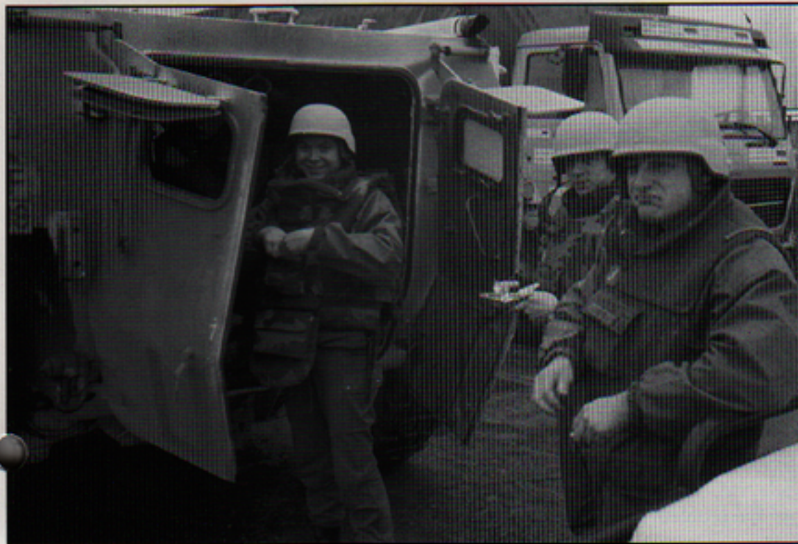
De svenska UNHCR-konvojerna med livsmedel till de nödlidande fick vid behov beväp- nad eskort.

– Våra konvojer blev aldrig beskjutna, men när vi var tvungna att korsa stridslinjen kunde skotten vira över oss. För säkerhets skull var vi klädda i skottsäkra västar och hjälmar.