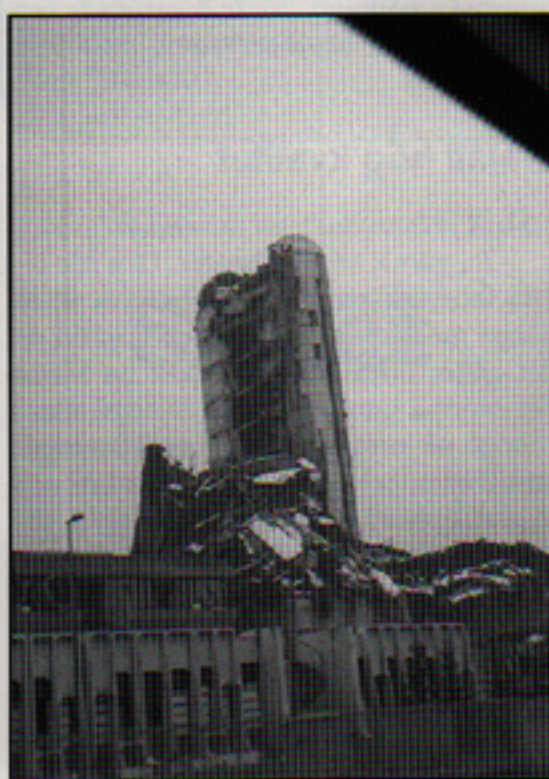
Ett av många sönderbombade hus i Sarajevo.