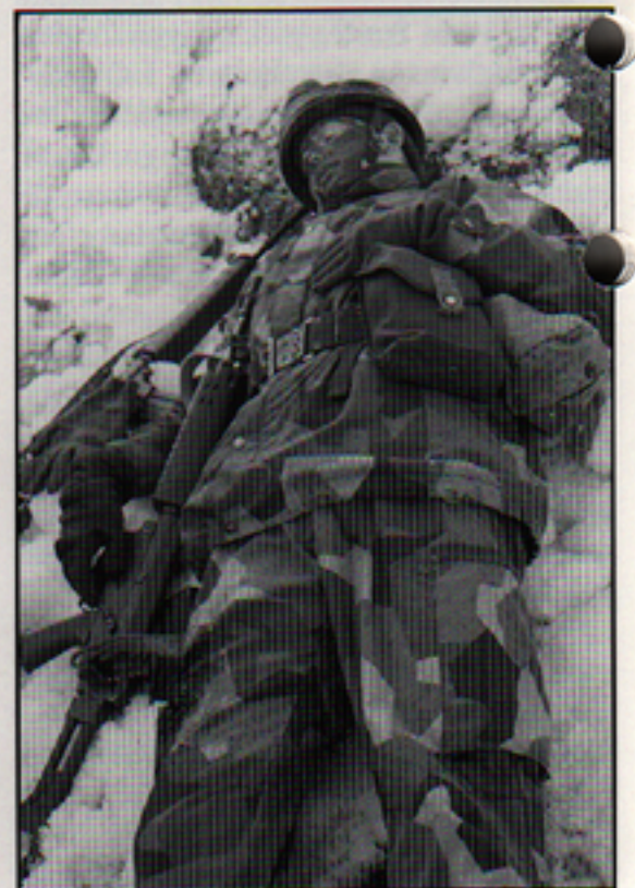
En sårad soldat med halva låret bortskjutet. Hur tar kamraterna hand om honom?