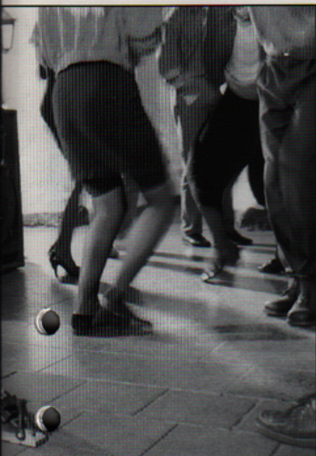
rs försöker med filmens hjälp få värnpliktiga att

dock ta till ibland. Eller snarare de som är på väg att bli professionella. Försvarsmedia anlitar då elever från teaterskolor.