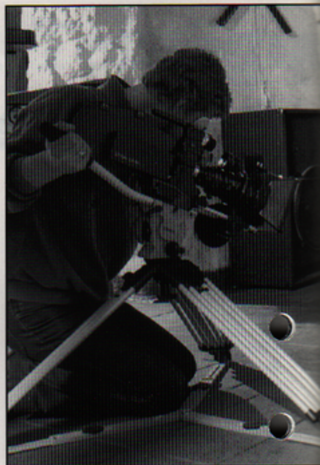
Miljöerna skiftar. Försvarsmedias Benny Wigensfors förstå effekterna av dålig skovård.

Efter kundens godkännande av manuset startar så småningom filmningen. Tid-