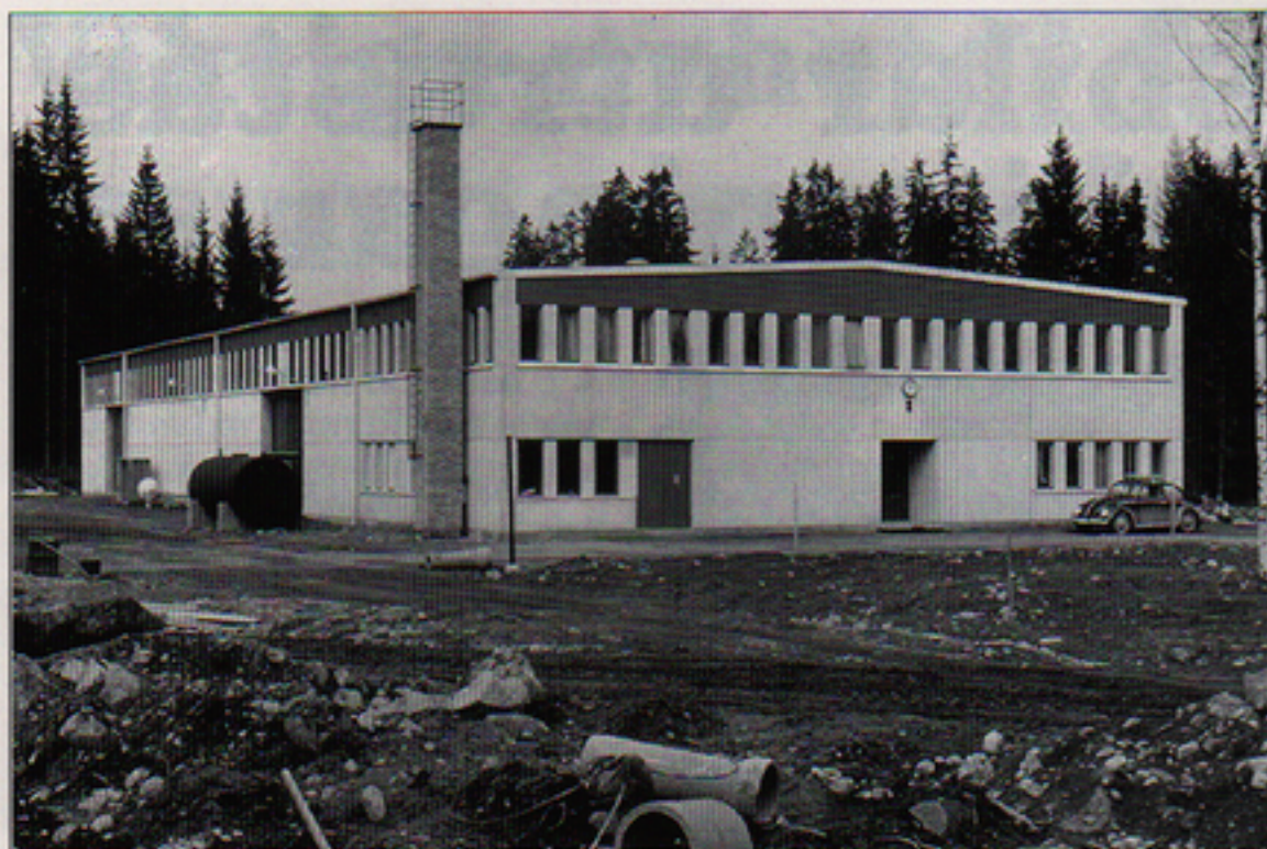
Nybyggarandan blomstrade 1964 och så småningom även verksamheten i Telubs första egna fastighet. Men nu är den inte vår längre. Ett bilföretag har tagit över. Lite vemodigt!