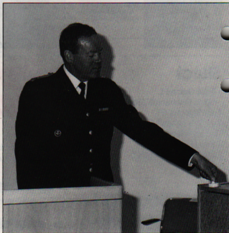
Ett tryck på knappen av flygstabschefen generalmajor Bernt Öst. Därmed var Flygvapnets Utbildningsanläggning Bas 90 på F14 i Halmstad invigd.