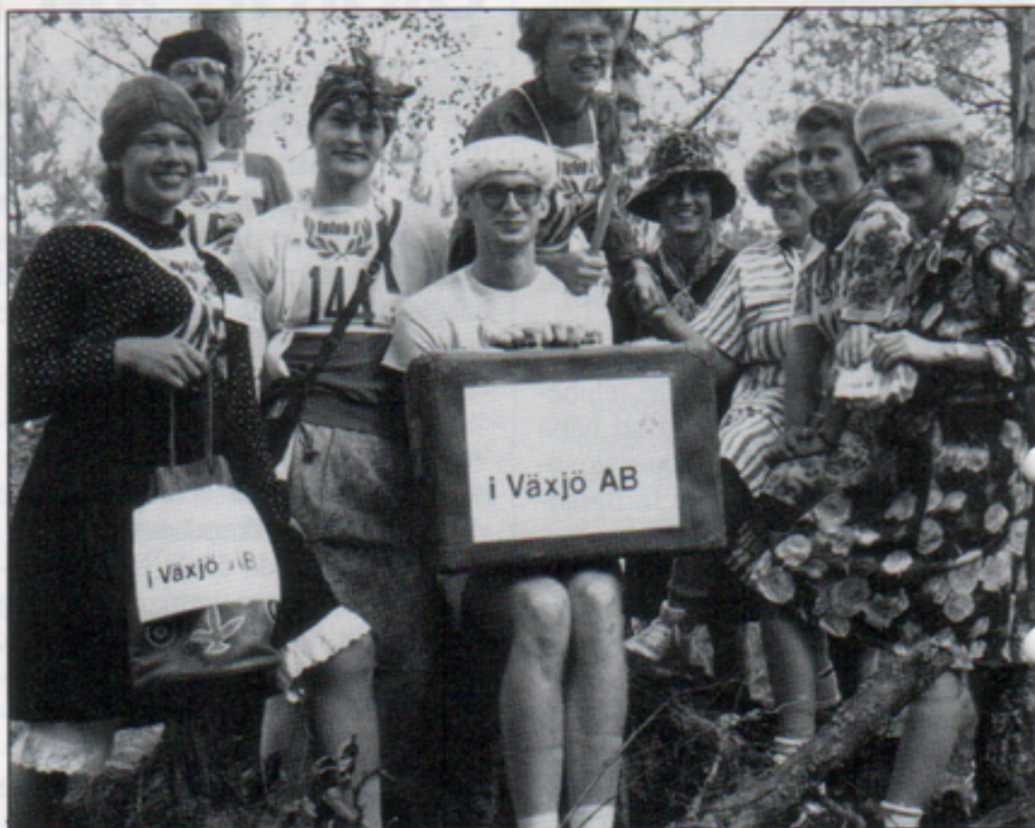
Visst är de charmiga, tanterna. Lag Tantstrul i Växjö AB fick pris för bäst utklädda lag.