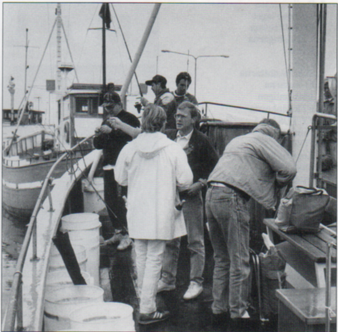
Förberedelserna är i full gång inför avfärden till det stora fiskafänget.