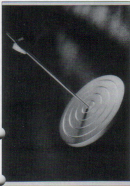
En Fullträff till Telub Inforum

Övriga vinnare blev Fläktkoncernen, S-E-Banken och Semper AB.