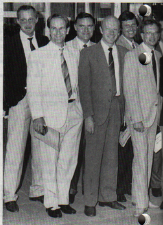
Telub Teknicks första "kull" av seniorkonsulter.

Utän tvekan var detta tillfälle ett viktigt steg i Telub Teknicks årtiondes historia.