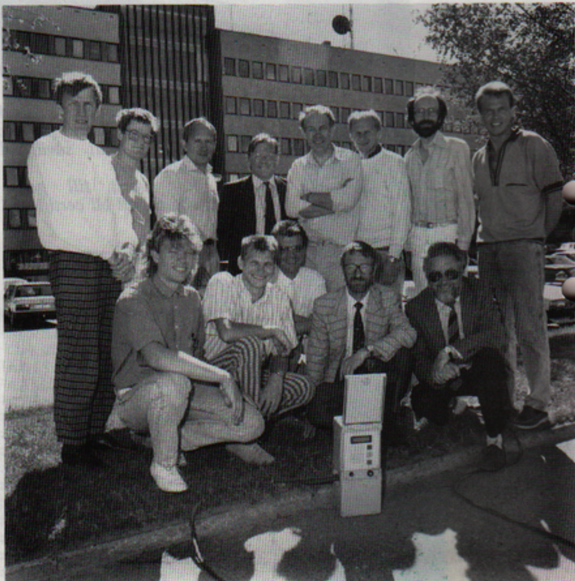
Telub Industris konstruktörer har all anledning att se nöjda ut. Vägverkets trafikmätutrustning är nu "i hamn".

Telub Teknik har svarat för program till de persondatorer som kan anslutas till mätutrustningarna samt för vissa mekaniska konstruktioner. Telub Inforum tar fram den tekniska dokumentationen och Telub Service ska ta hand om underhåll och service.