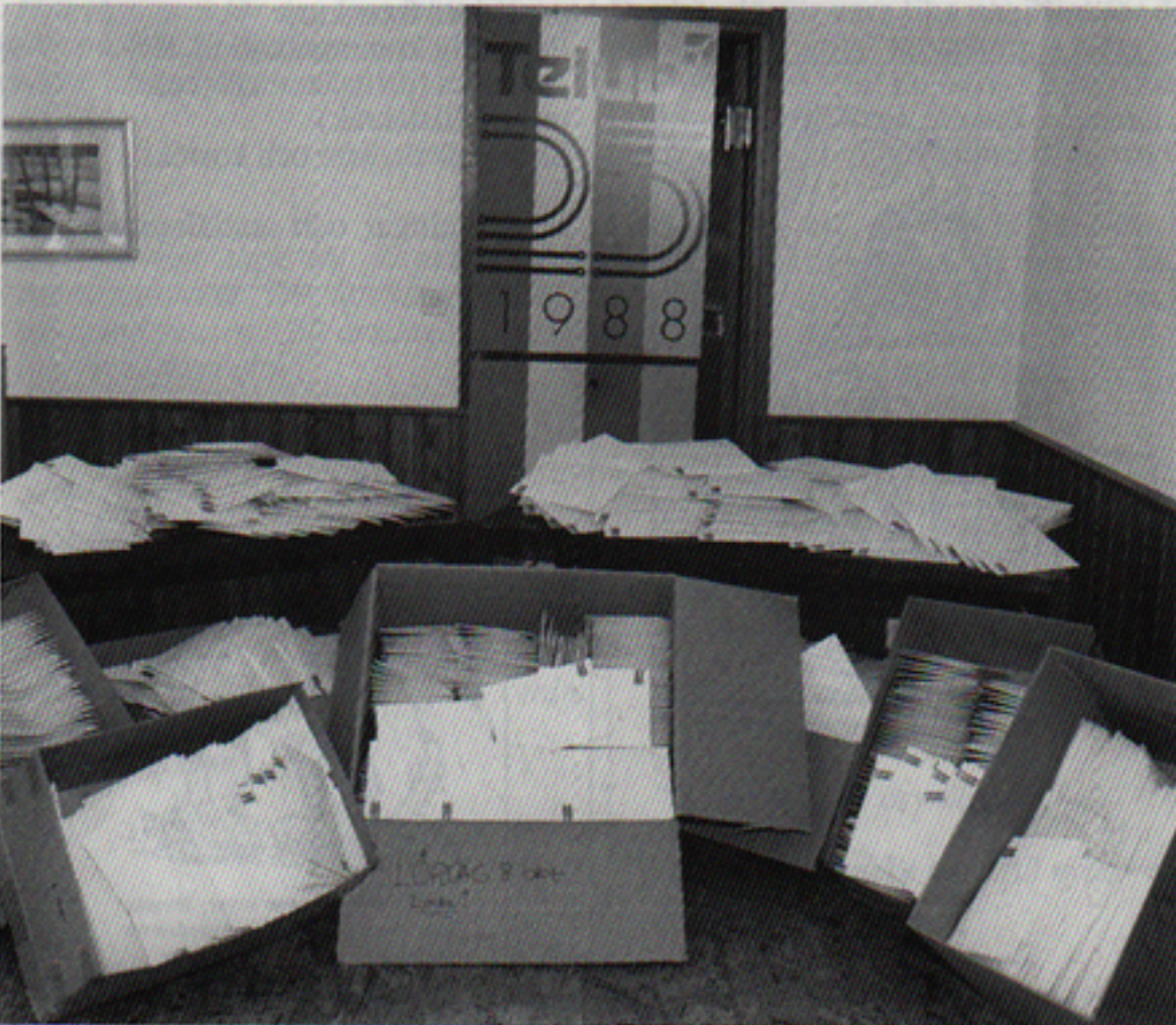
Det är en ansenlig hög av kuvert med jubileumsklockor och inbjudningskort som har sänts ut. Nu väntar jubileumskommittén spänt på alla svarskorten.