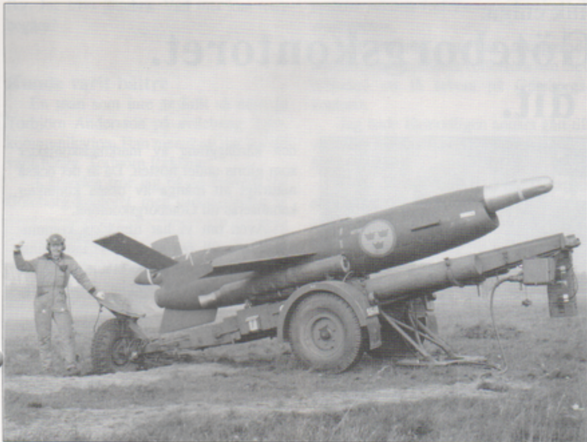
Nu smäller det! Roboten, kopplad till centralinstrumentet som beräknar skjut-data, är snart på väg.