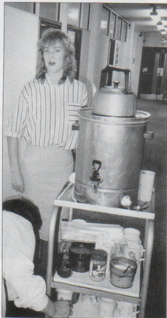
Ett viktigt inslag i det engelska arbetslivet - tevagnen som förgyller tillvaron tre gånger om dagen vid varje skriv- och ritbord.

-Just nu arbetar väldigt många i Portsmouth med att ta fram teknisk dokumentation till tågagnar på uppdrag av British Rail Engineering. Ett annat intressant uppdrag de har är att rita om hela järnvägsnätet i södra England.