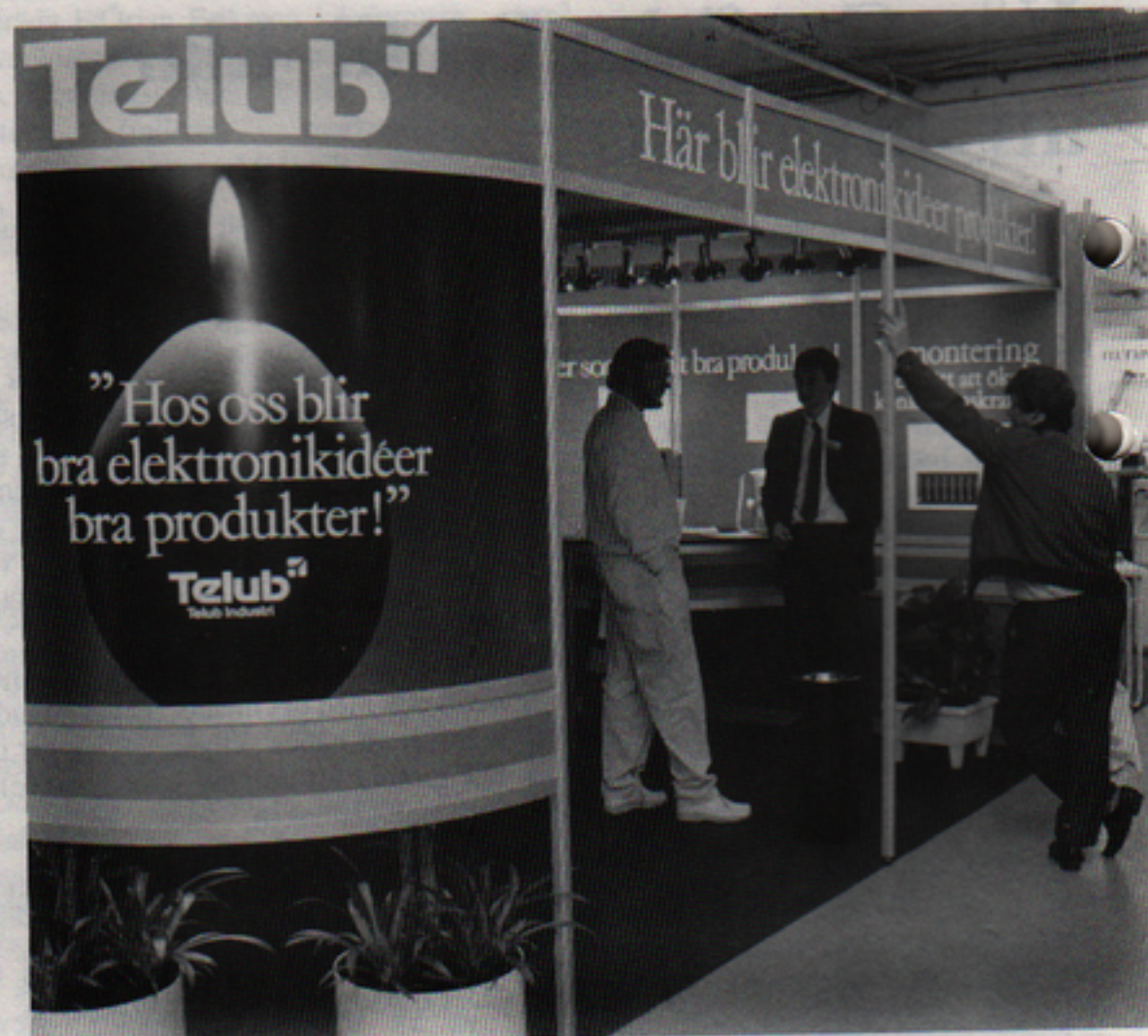
Telubmontern på mässan "Konstruktion & Design 87" stod sig mycket bra i konkurrensen om mässans besökare, inte minst utseendemässigt.