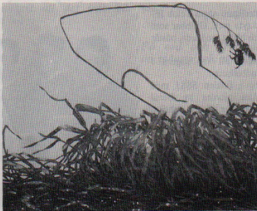
"Det längsta strået" 70x50 cm. Färglitografi: grön/gråsvart.