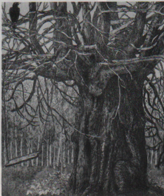
"Munin", 50x70 cm. Litografi: stålgrå