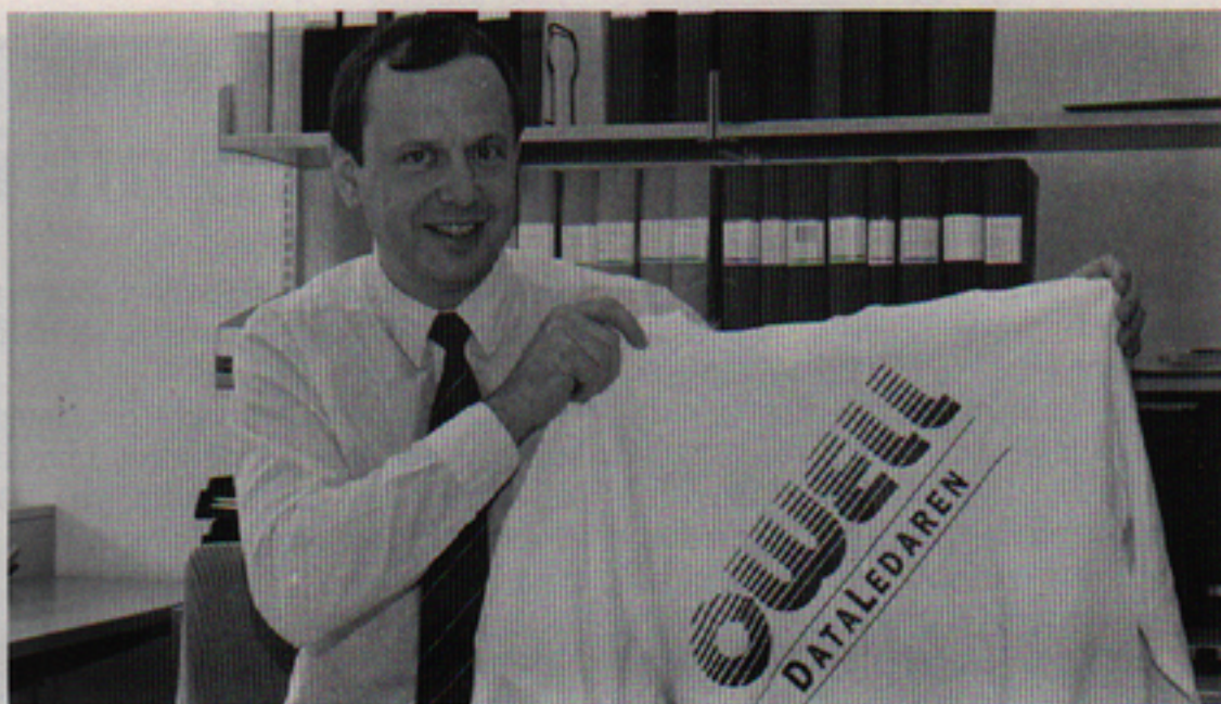
- Owell som dataledare är ett bra mål. Jag hoppas vi ska kunna leva upp till det, säger Gündor.

-Owells historia och bakgrund ligger oss ännu i fatet. Och enligt min mening har man hittills varit något för optimistisk. Vad som nu behövs är en