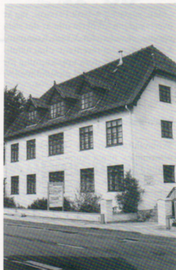
Nog har man lyckats få in Telub A/S servicekontor i Aalborg i en fin gammal fastighet.

Telub A/S på Hasserisvej 102 i Aalborg är alltså nu ordentligt invigt och livet har återgått till det normala servicelivet.