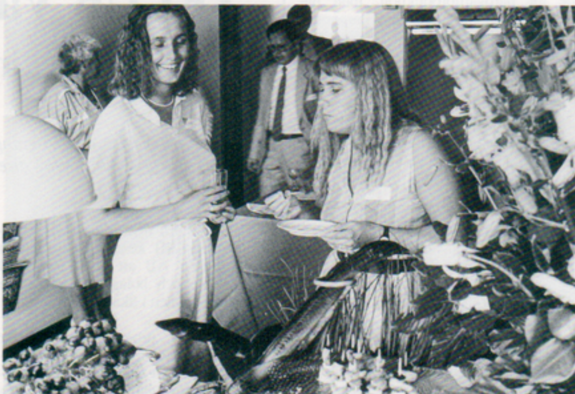
– Så mycket läckerheter de har dukat upp. Receptionsbesökarna lät sig väl smaka.