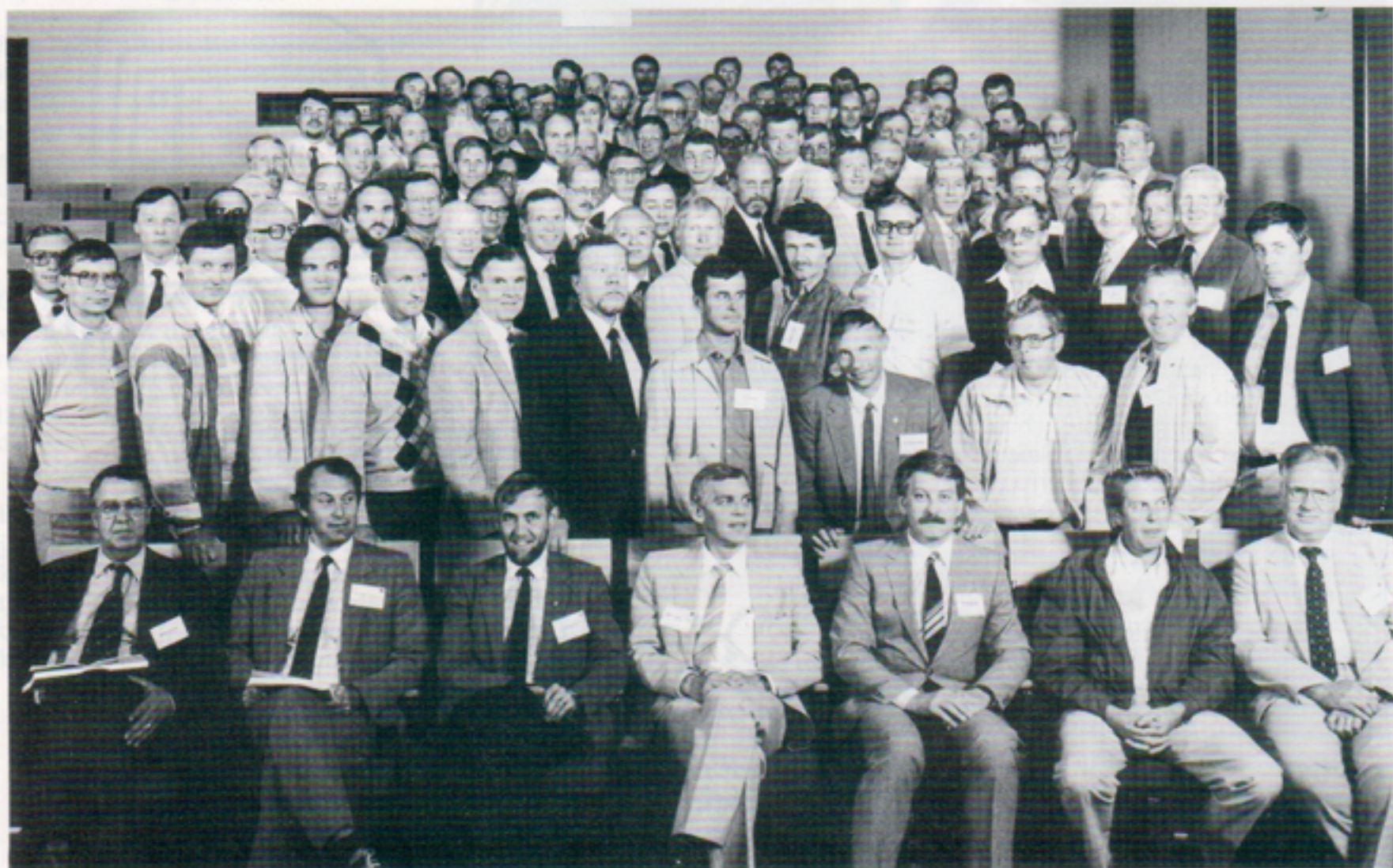
Denna grups gemensamma intresse är försvarets telekommunikation. Under två dagar i augusti konfererade de i Växjö under temat Telenät.