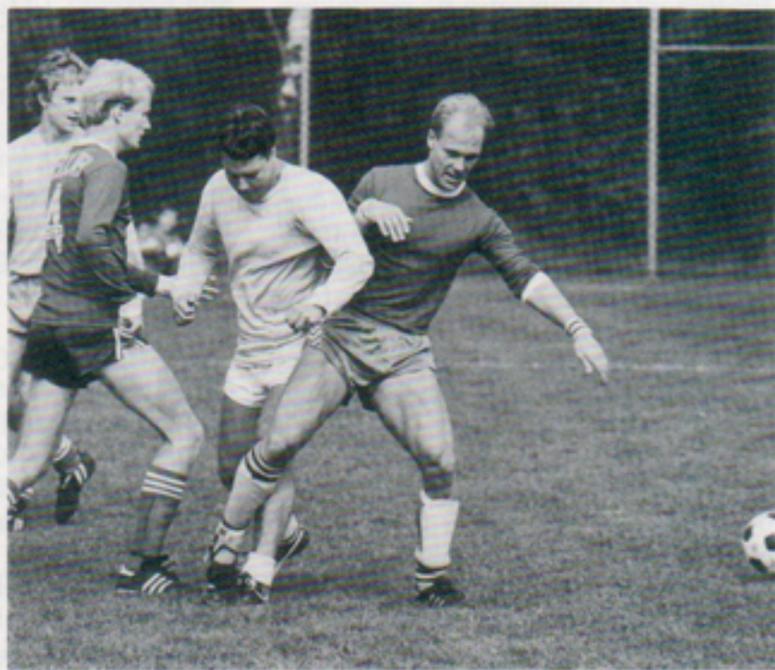
Våra tjejer och killar kämpade tappert och kom också så småningom upp på prispallen.