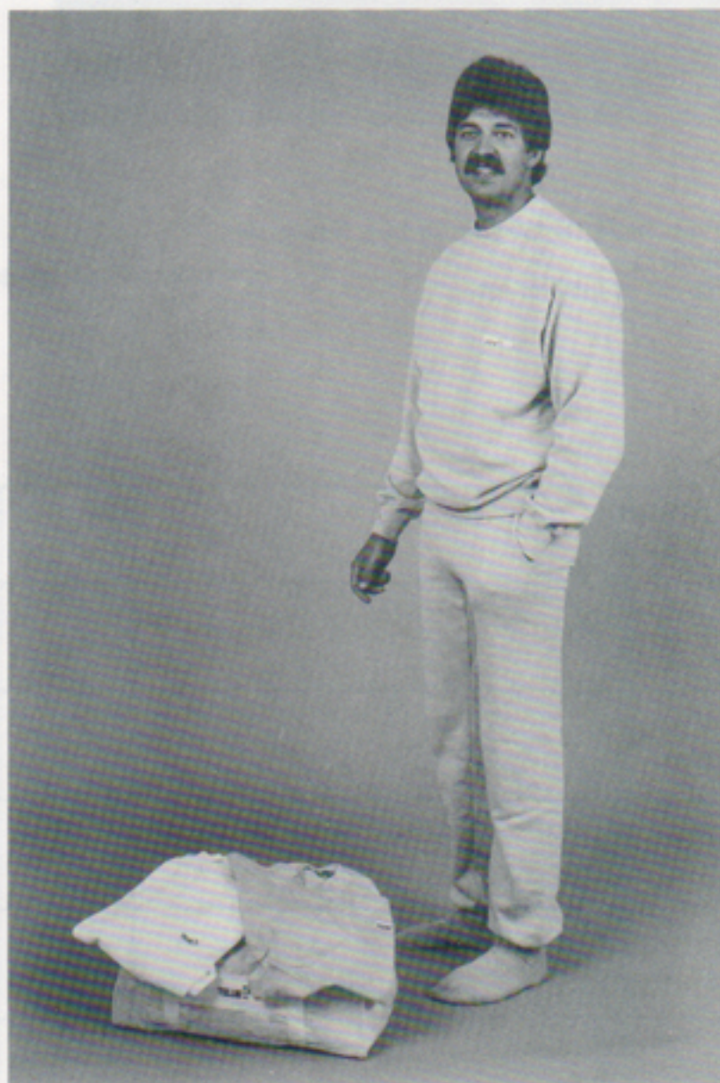
Joggingoverall 100 % bomull stl S-XL Färg: rosa, ljusblå, grå, mint, signalröd Pris: 148:-