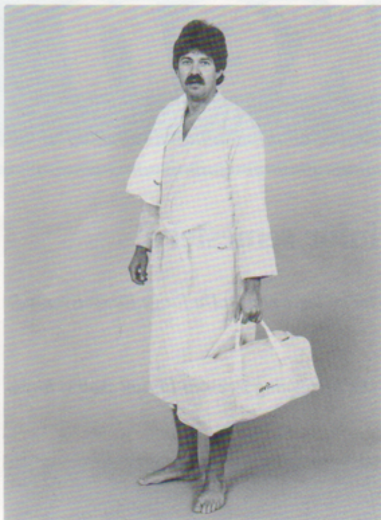
Frottébadrock 430 g/m 2 stl M L (universalstorlek)