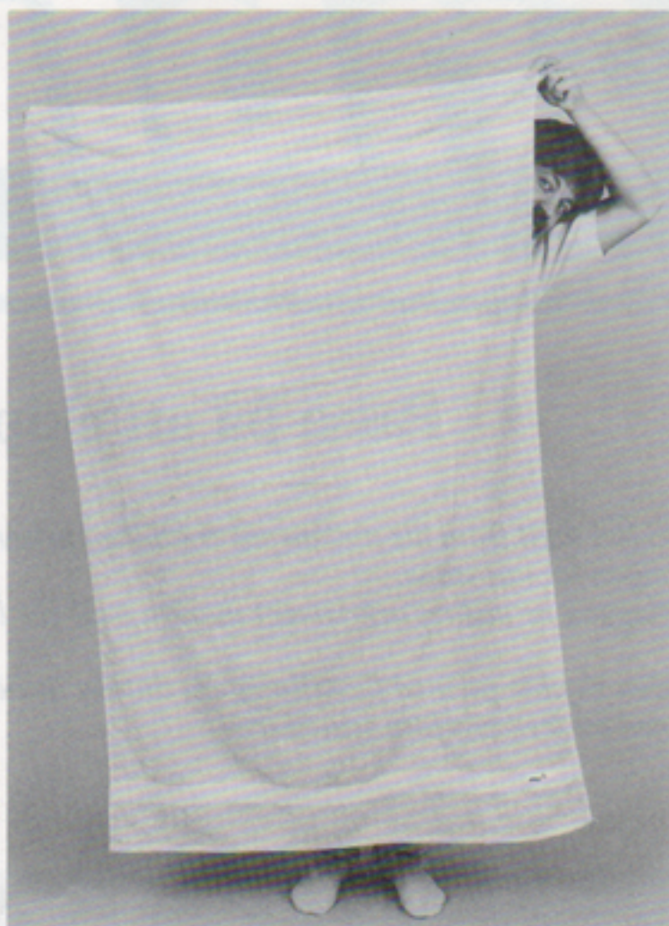
Frottébadlakan 430 g/m 2 stl

Sportväska i oxfordnylon Färg: Vit Pris: 59:-