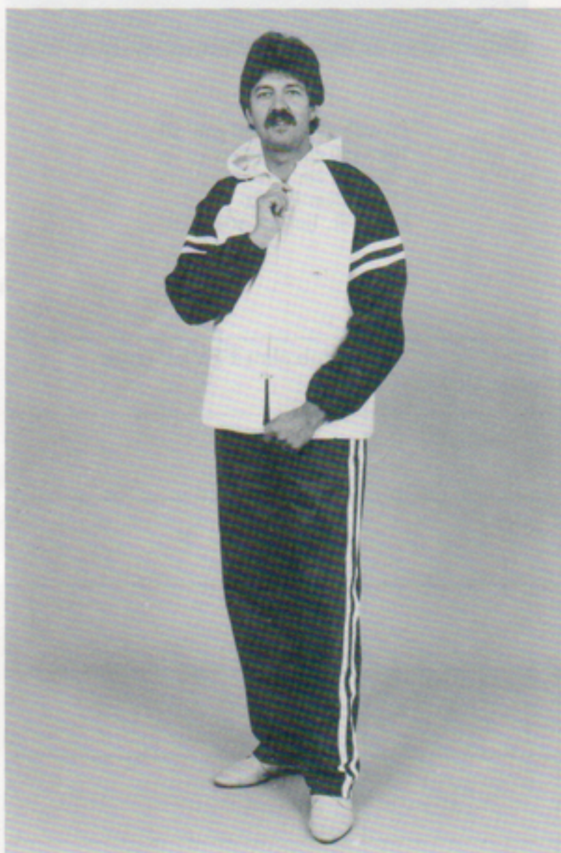
Regnställ i pvc-plast, jacka med huva + byxa Färg: blå-vit stl S-XL Pris: 50:-

Men skynda på med beställningen, antalet är begränsat. Får vi Din beställning före den 10 juni skall vi hinna med att leverera före semestern.