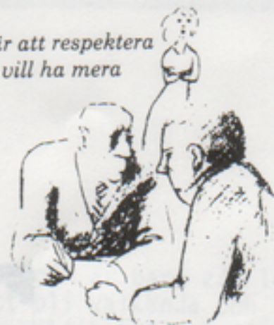
Ur tidningen Personal männikor och arbete 1983

Förhandling är att respektera också andra vill ha mera