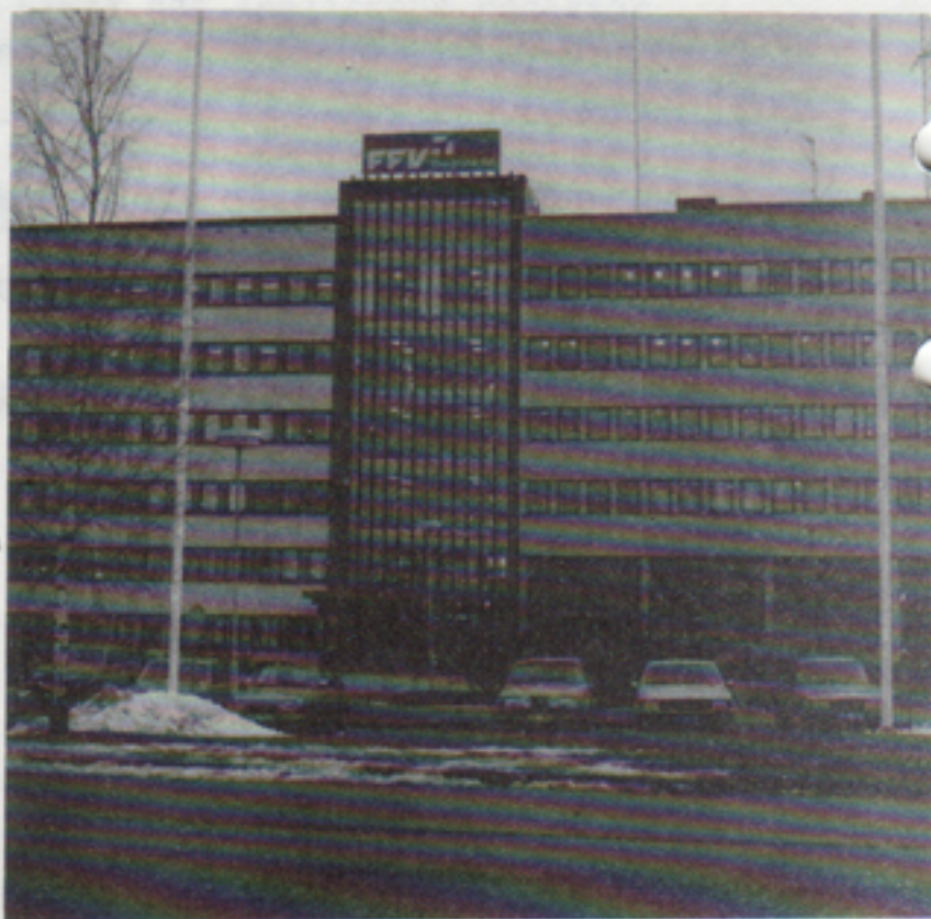
FFV Elektronik AB och Telub AB samsas på samma väg ...